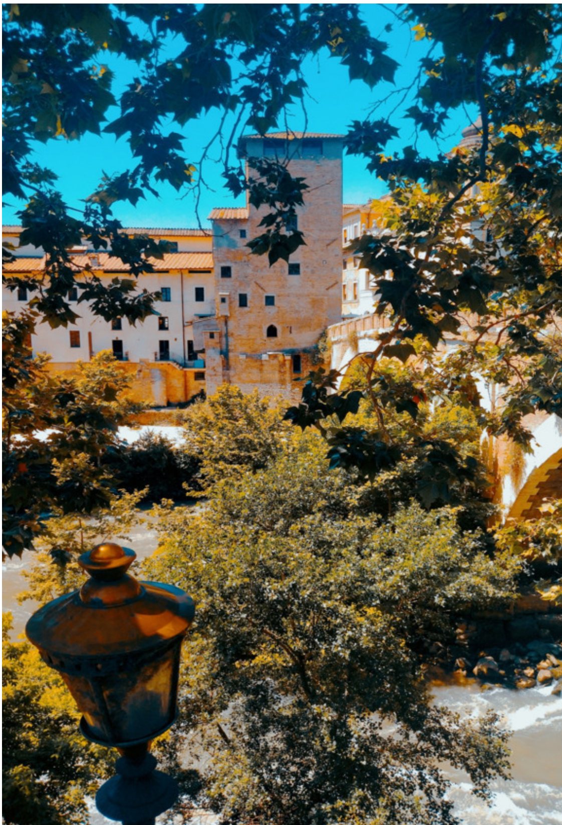
Берег Тибра – именно сюда, по легенде, волны вынесли на берег корзину с младенцами

С помощью своих единомышленников, среди которых немалую часть составляли преступники и беглые рабы, Ромул и Рем заманили Амулия в засаду и убили его, вернув на пре-