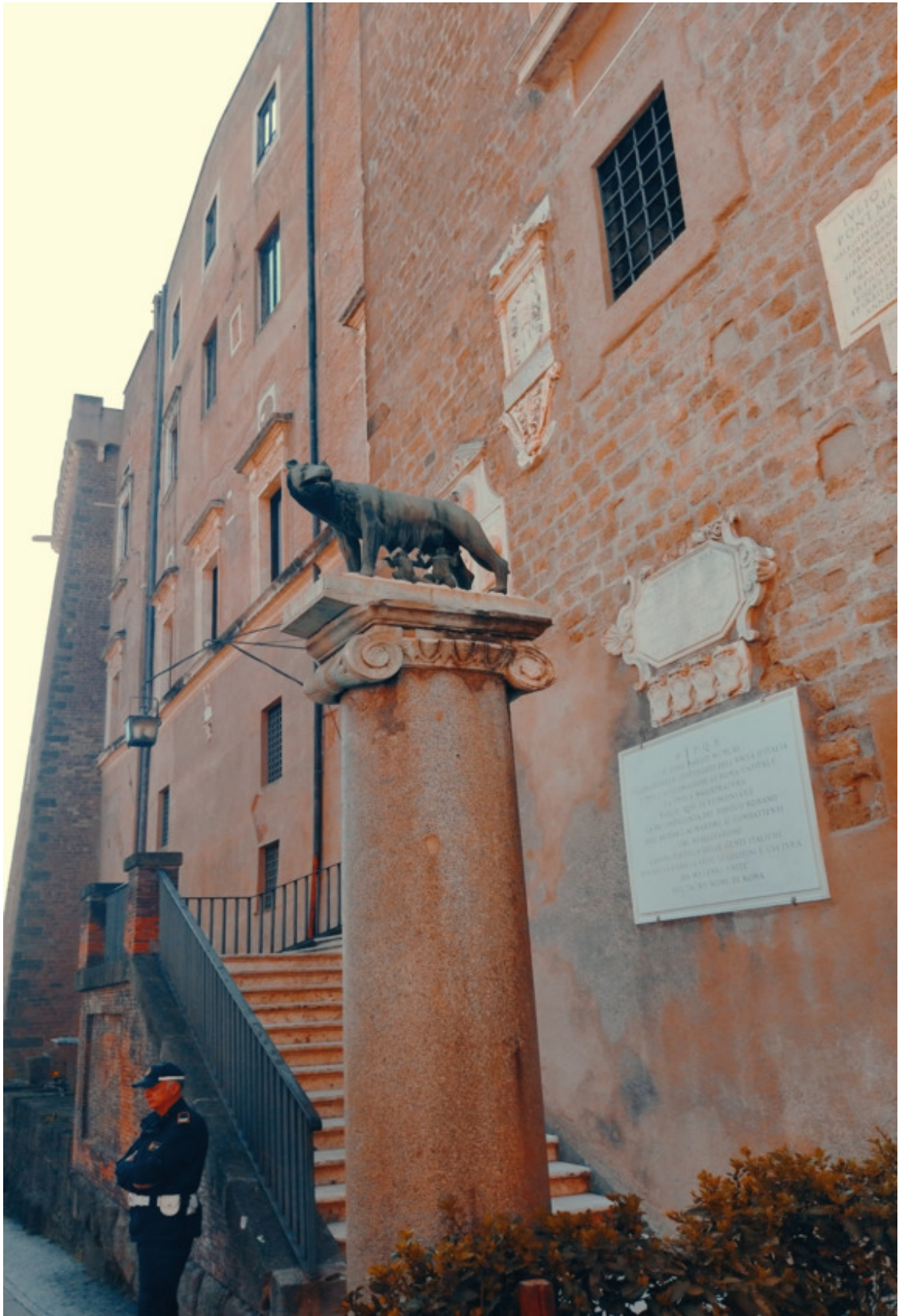
Волчица с близнецами Ромулом и Ремом и сегодня являются символом Рима. Статуя волчицы на Капитолийском холме.

стол своего деда, и восстановив таким образом справедливость и нарушенный порядок вещей, а также решили основать свой собственный город.