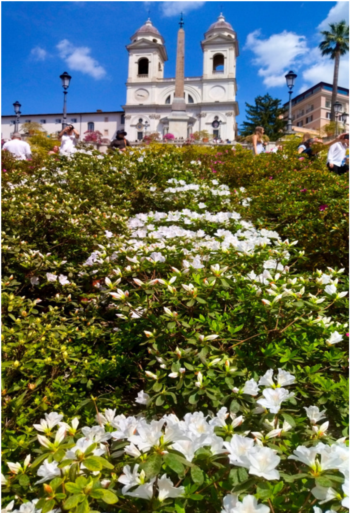
Каждый год в апреле азалии украшают в самом центре Рима ступени Испанской лестницы на день рождения города

Первым действием Ромула было укрепление Палатинского холма. Он проложил границы города бороздой, которую вспахал и со своими последователями, и приступил к работе по стро-