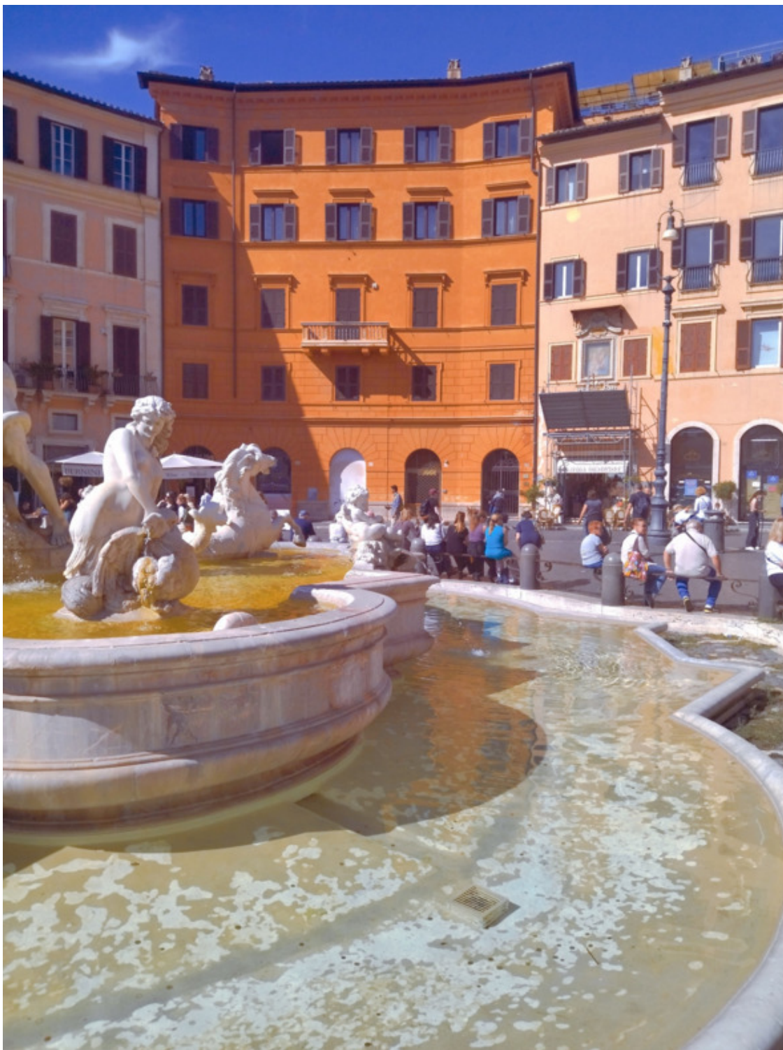
Площадь Навона (piazza Navona) располагается на территории бывшего Марсова поля. В 1 веке н.э. здесь находился стадион Домициана, в Средневековье – городской рынок