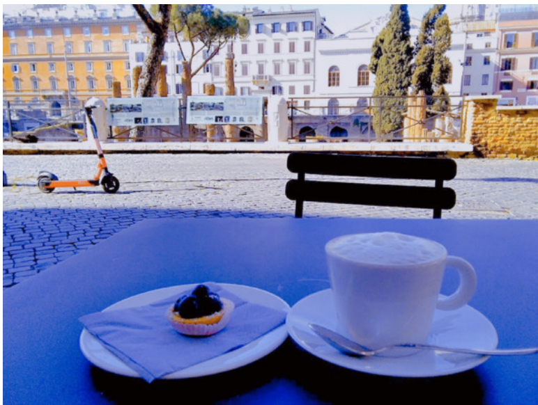
Кафе на площади Торре Арджентина – часть древнего Марсова поля