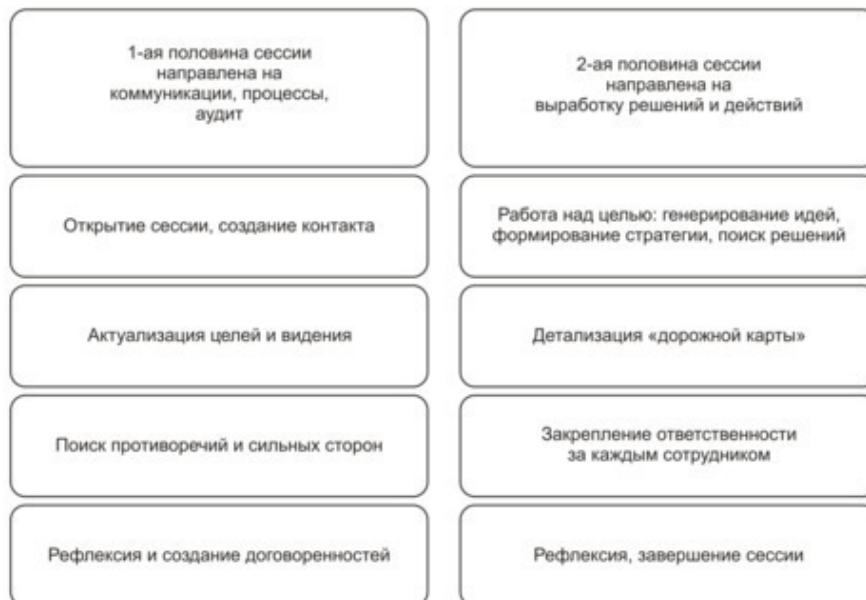
рис. 2: дизайн командной сессии

Держайте и получайте удовольствие от процесса и результата! Продуктивных командных сессий!