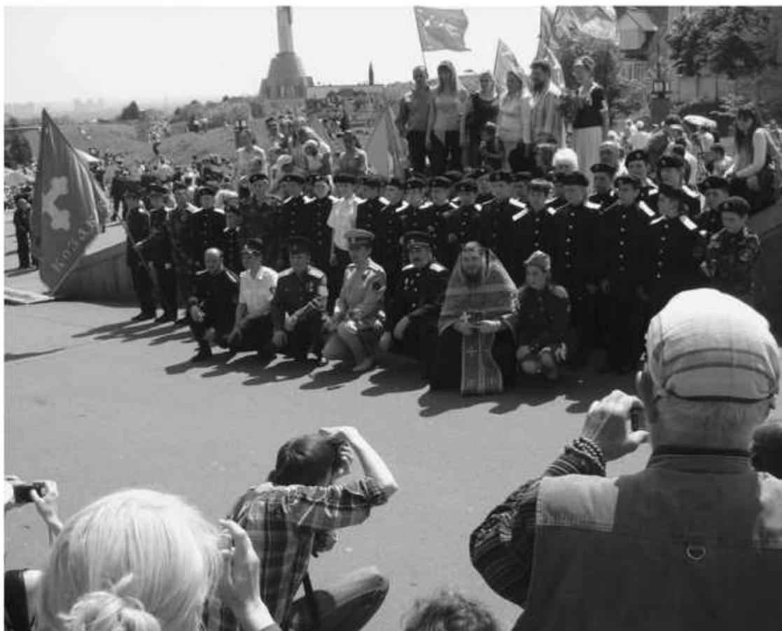
Казачи и кадеты «Верного Казачества». Я 5-й слева