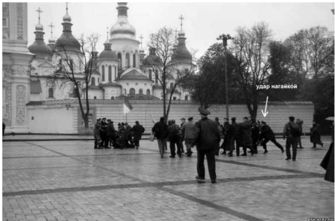
Драка казаков и «свободовцев» в день Покрова

Буквально через секунд 20 прибежали остальные казаки и устроили прямо вокруг меня драку со «свободовцами». Флаг я отобрал и успел даже немного «помять» вороватого последователя Бандеры.