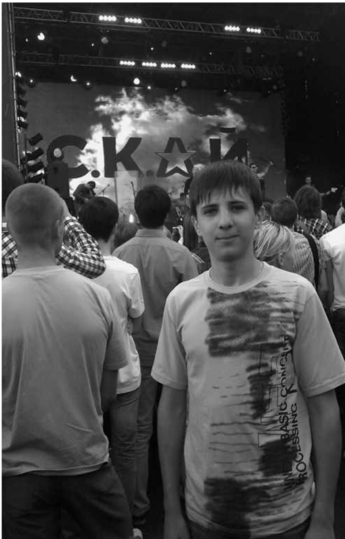
На рок-концерте, посвящённом 1025-летию Крещения Руси