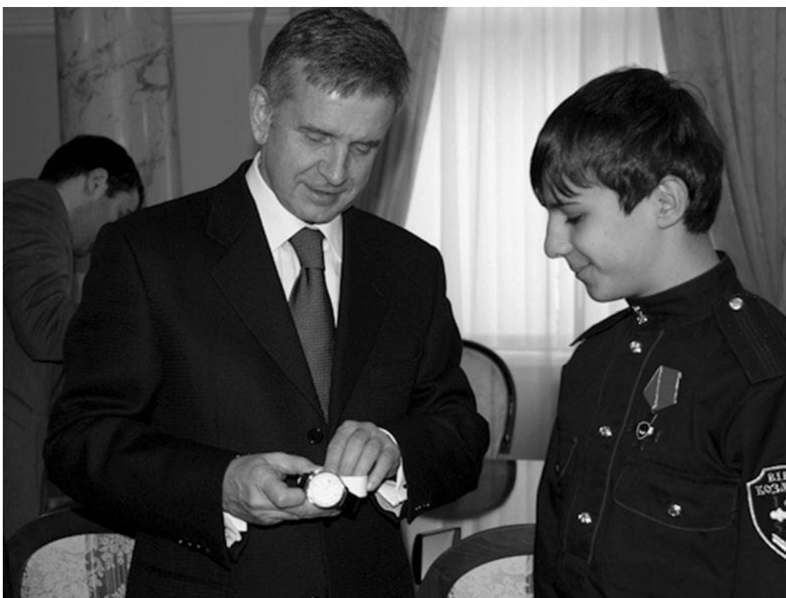
Награждение меня часами от В. В. Путина Послом России на Украине