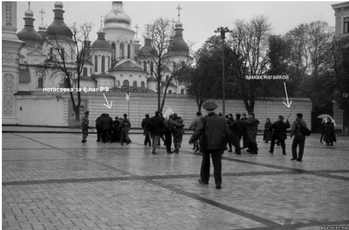
Драка казаков и «свободовцев» в день Покрова