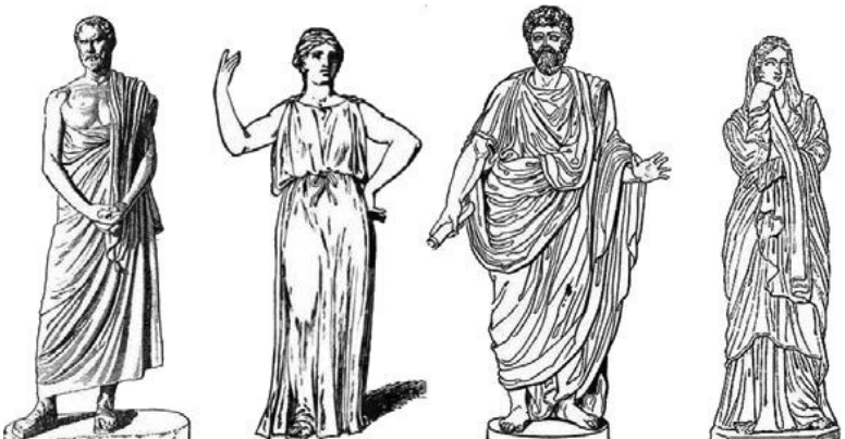
Слева направо: греческий мужчина в плаще (гиматии), греческая женщина в тунике (хитоне), римский мужчина в тоге и римская матрона в мантии (палле). Изображение из открытого доступа

Ношение тоги – в равной степени искусство и испытание, ведь любое неловкое движение, меняющее угол сгиба в локте левой руки, мгновенно рушит всю композицию из бесчисленных идеальных складок. Поэтому большинство мужчин на нашей улице оставили свои тоги дома и отправились по делам в коротких туниках. Некоторые женщины завернулись в традиционную мантию римской матроны – паллу. Остальные одеты в длинные туники всевозможных расцветок.