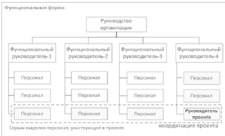
Рисунок 1.2. Функциональная форма организации проектного управления

Преимуществом данной формы организации является возможность привлечения специалистов разных профилей и отсутствие необходимости создания отдельного проектного подразделения, которое потребует дополнительных затрат.