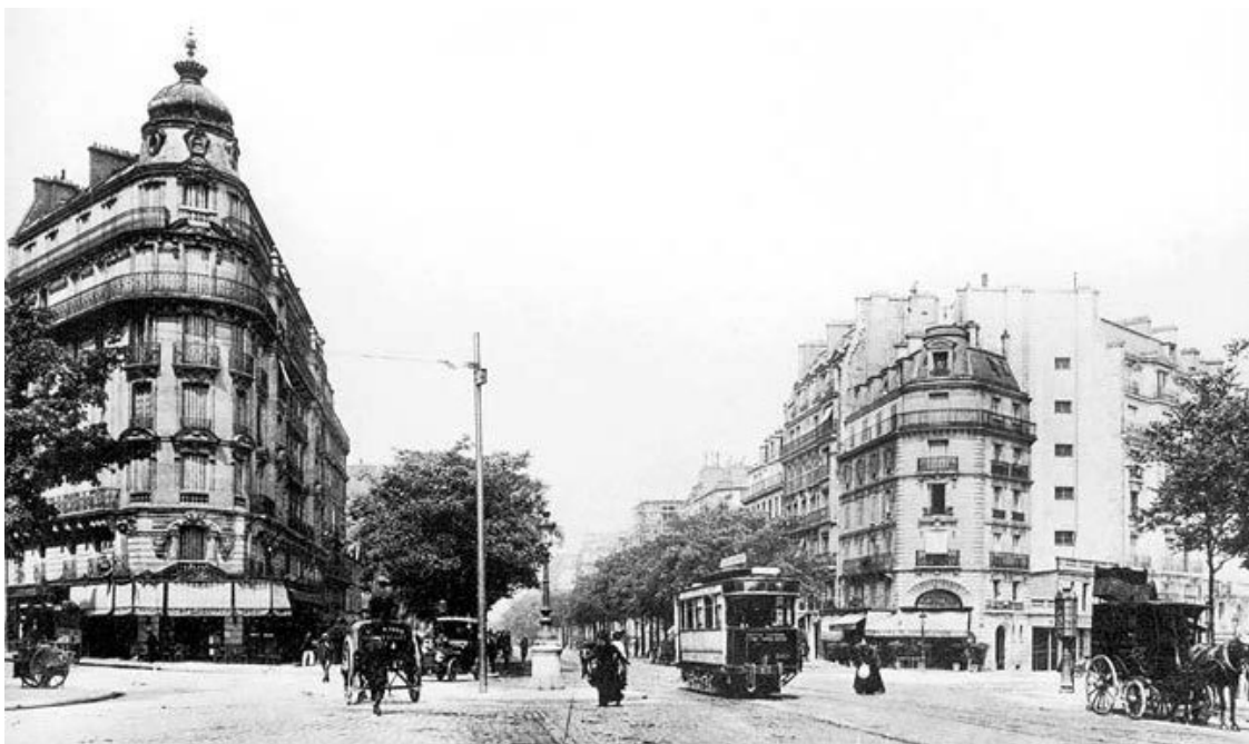
Бульвар Монпарнас в начале XX в.

Для писателей Бодлера, Шатобриана, Готье и Золя из уютных ресторанчиков, до сих пор окруженных кустами сирени, стал любимым «Клозри де Лиля» («Сиреневый хуторок»), расположенный на одном конце бульвара. На другом же, где позже появились «Ротонда», «Дом», «Селект» и другие кафе, навсегда стали художники, которые создали образ парижской жизни, ставший стереотипным.