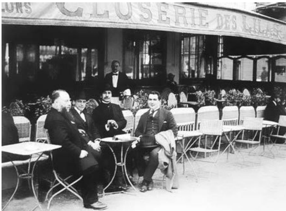
Поэт Поль Фор (второй справа) с друзьями в кафе «Клозри де Лиля»

Для писателей Бодлера, Шатобриана, Готье и Золя из уютных ресторанчиков, до сих пор окруженных кустами сирени, стал любимым «Клозри де Лиля» («Сиреневый хуторок»), расположенный на одном конце бульвара. На другом же, где позже появились «Ротонда», «Дом», «Селект» и другие кафе, навсегда стали художники, которые создали образ парижской жизни, ставший стереотипным.