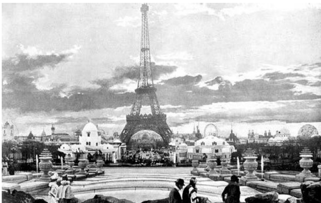
Панорама Всемирной выставки. Париж, 1900 г.

Все эти течения были в общем-то чужды французскому искусству того периода. Однако, как это на первый взгляд ни странно, именно Париж стал Меккой для художников из многих стран мира. И не только для них. В 1903 г. здесь появляется американская писательница Гертруда Стайн, известная скорее как эксцентричная богемная фигура. Позже, уже после Первой мировой войны, завсегдатаями монпарнасских кафе станут Хемингуэй, Джойс, Фицджеральд и многие другие будущие литературные кумиры. Манил их не только парижский флер, но и сравнительное благополучие страны, прочно основанное на твердом франке.