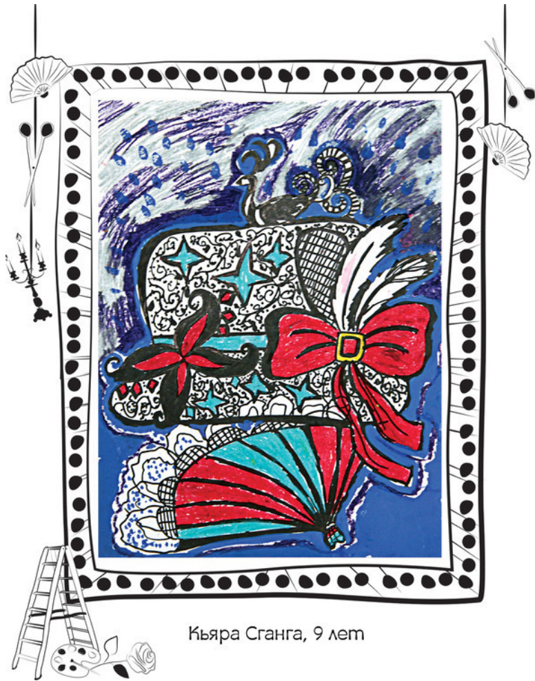
Къяра Сганга, 9 лет