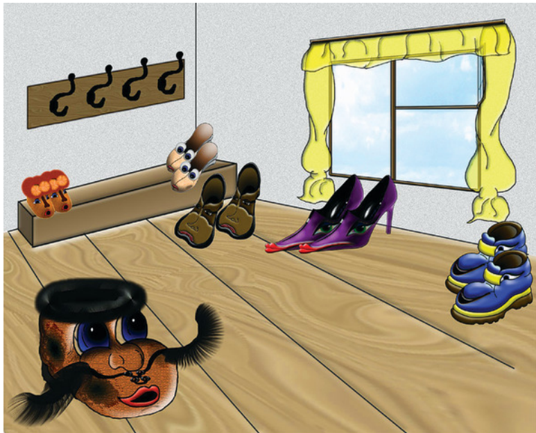
Рисунок Галины Маларёвой

Прошло два месяца. Башмак больше не пытался летать, но думать об этом не перестал.