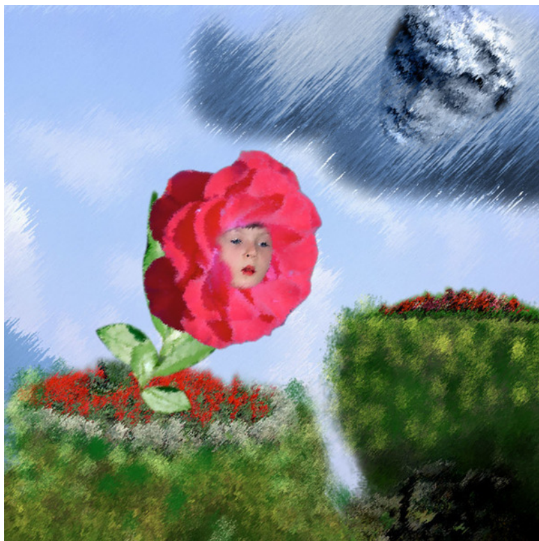
Рисунок Галины Маларёвой

Ветер. Это был не легкий ветерок – друг Цветка, а страшный и своенравный вихрь. Но Цветок настолько был занят своими мыслями, что не заметил, как Холодный Ветер подлетел к нему, вырвал с корнем и куда-то понес.