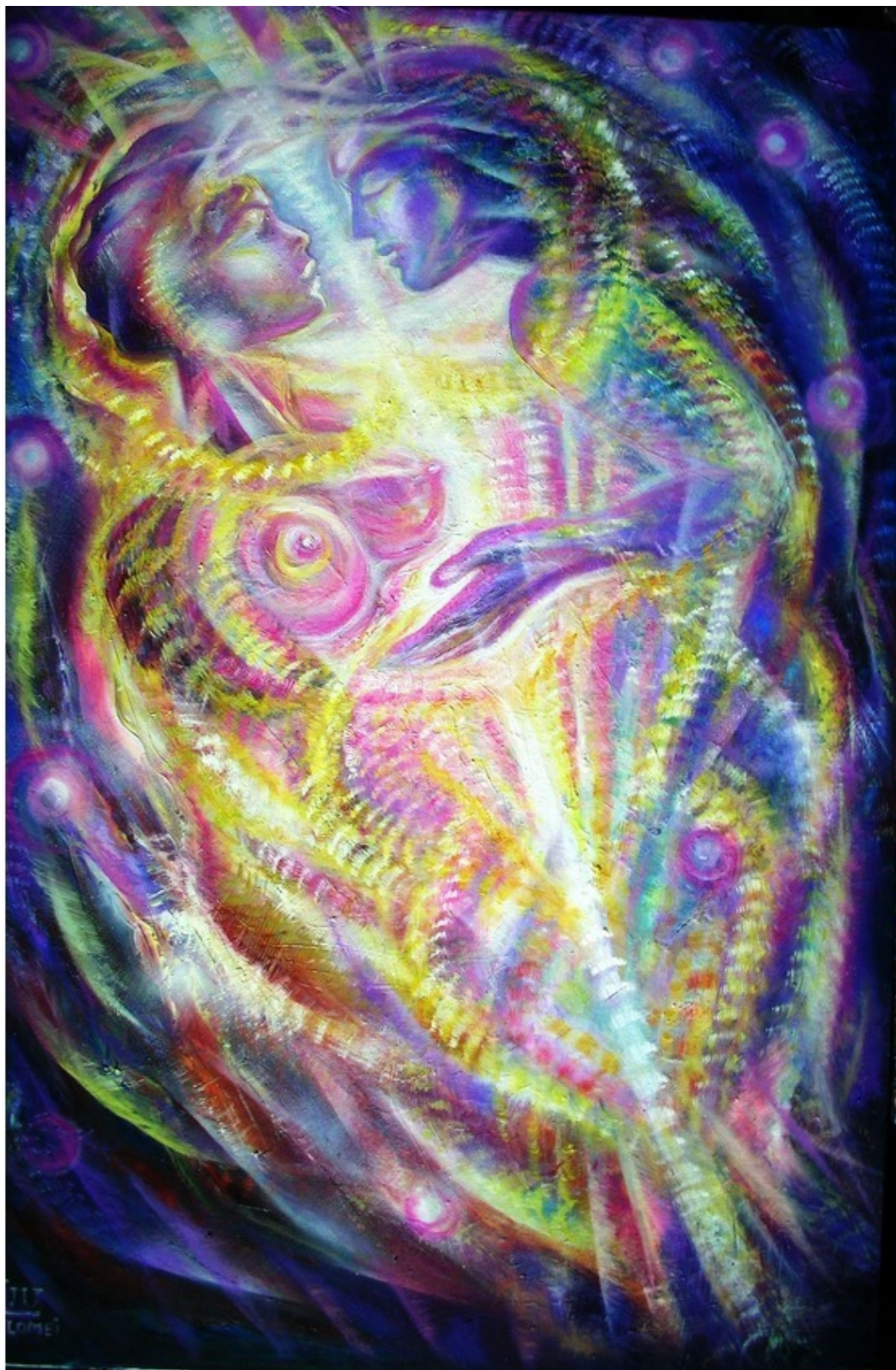
Море любви... Эзотерическая картина Юлии Лагус.