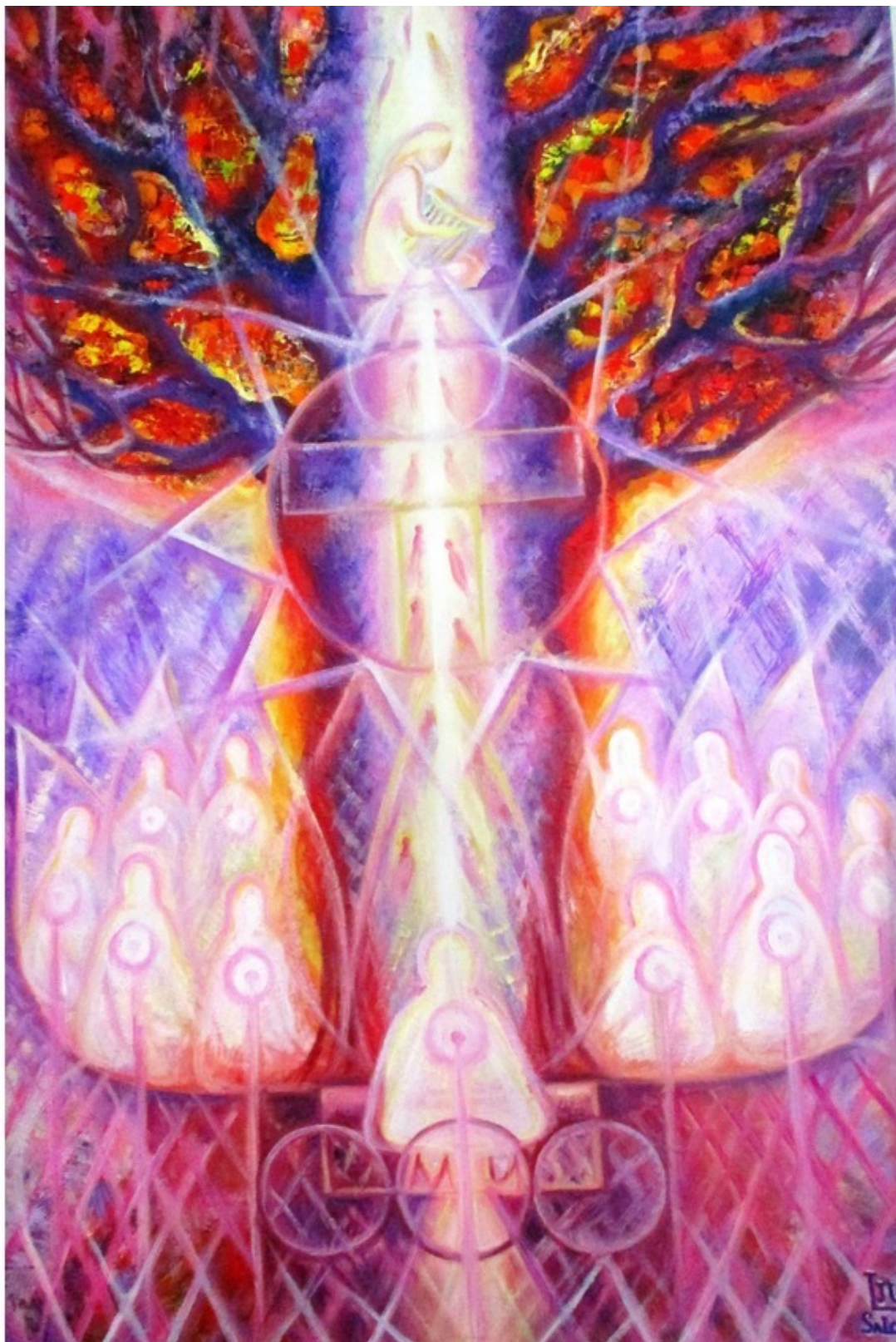
«Дерево жизни, путешествие в прошлое и будущее» – эзотерическая картина о Лемурии кисти художника Юлии Лагус