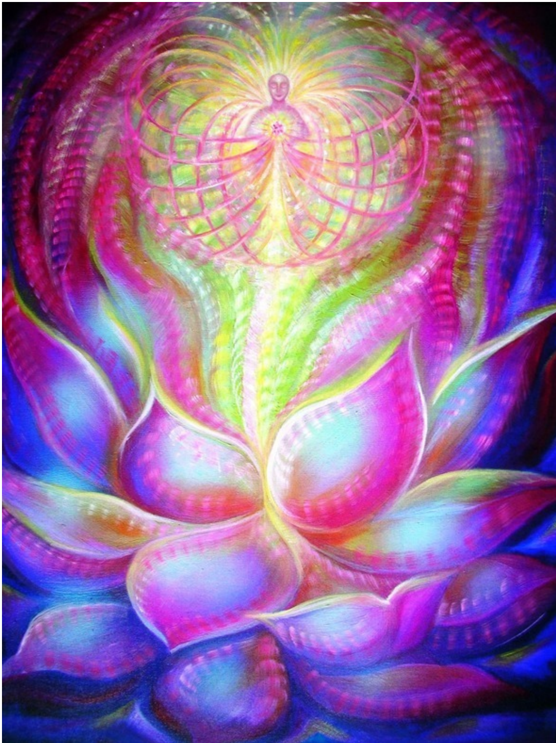
Цветок любви. Эзотерическая картина художника Юлии Лагус.

Только я могла, напившись вдребезги, орать на всю улицу: «Звёзды, загадывайте желание,