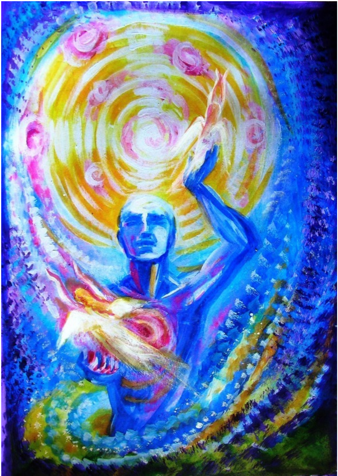
Отпускаю души в ночь... Эзотерическая картина Юлии Лагус