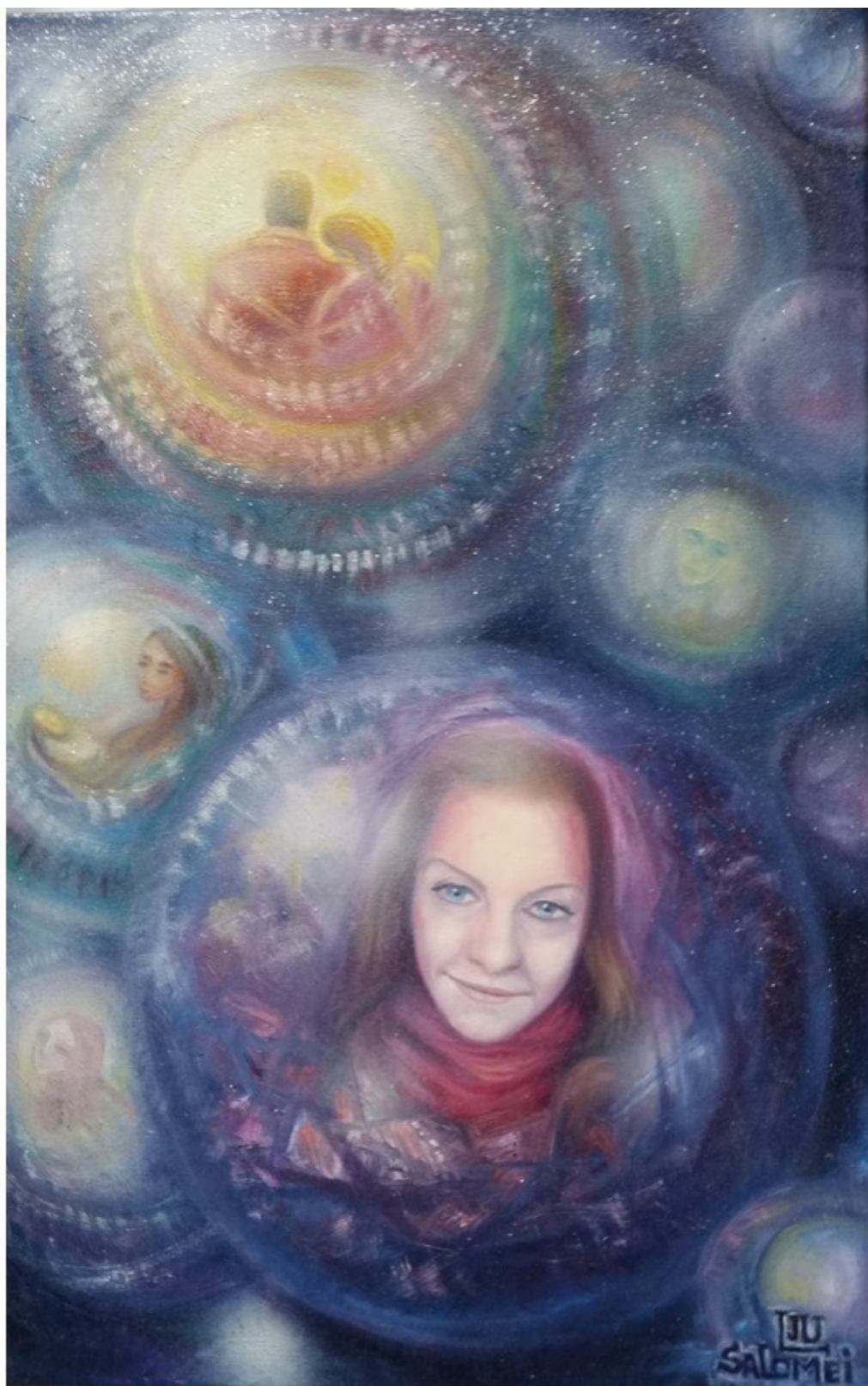
Твой шарик души голубой... Эзотерическая картина Юлии Лагус