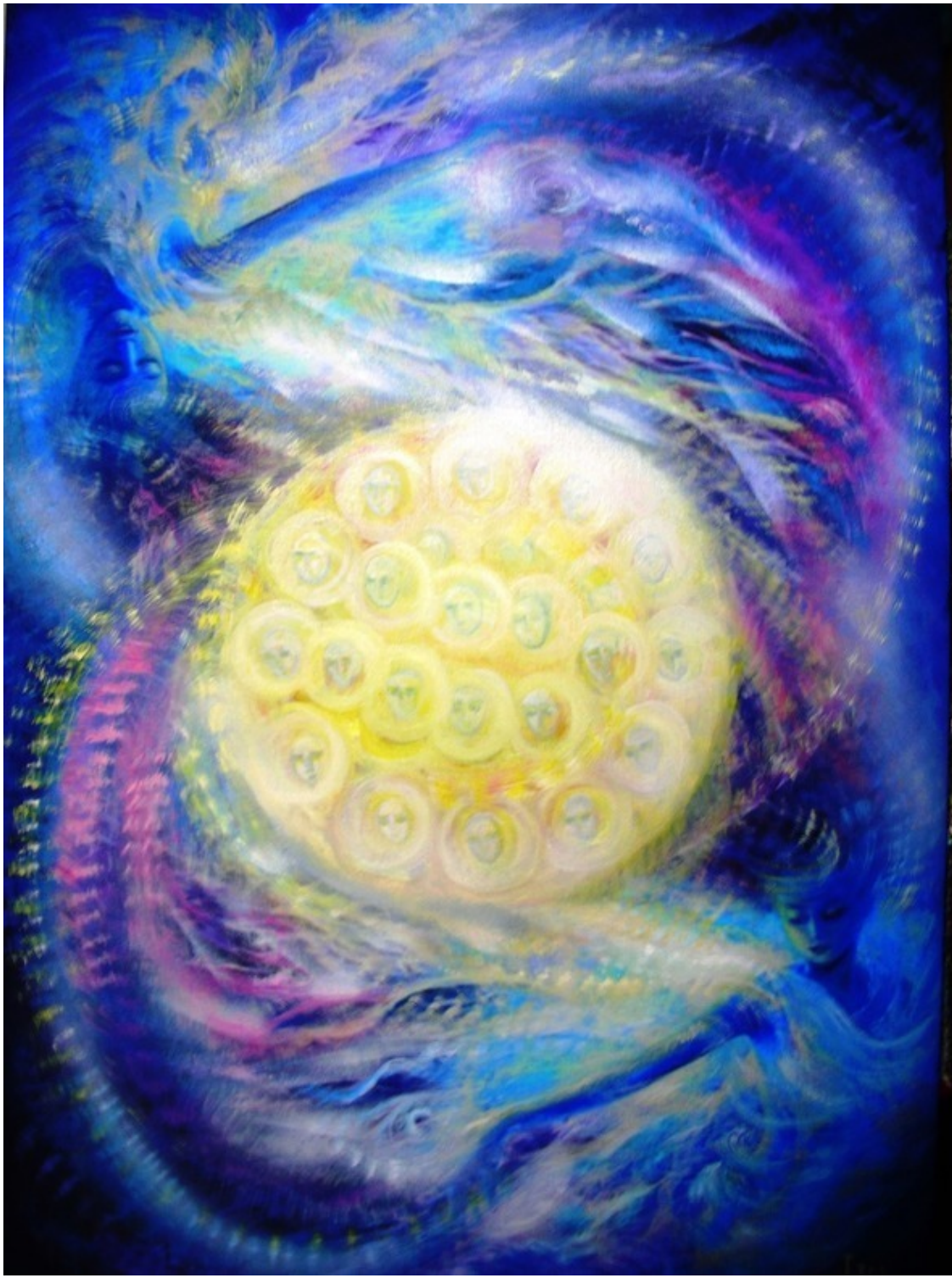
В сине-звёздной вышине... Эзотерическая картина Юлии Лагус