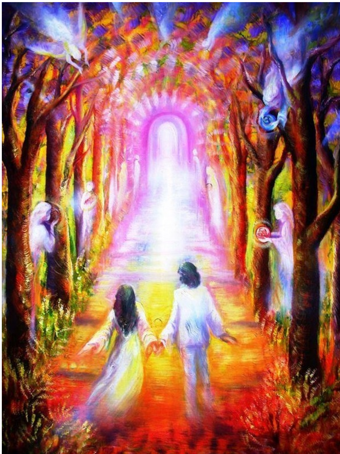
Перья крылатых Богинь... Эзотерическая картина Юлии Лагус.