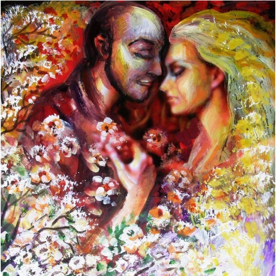
Любовь с первого взгляда... Эзотерическая картина Юлии Лагус