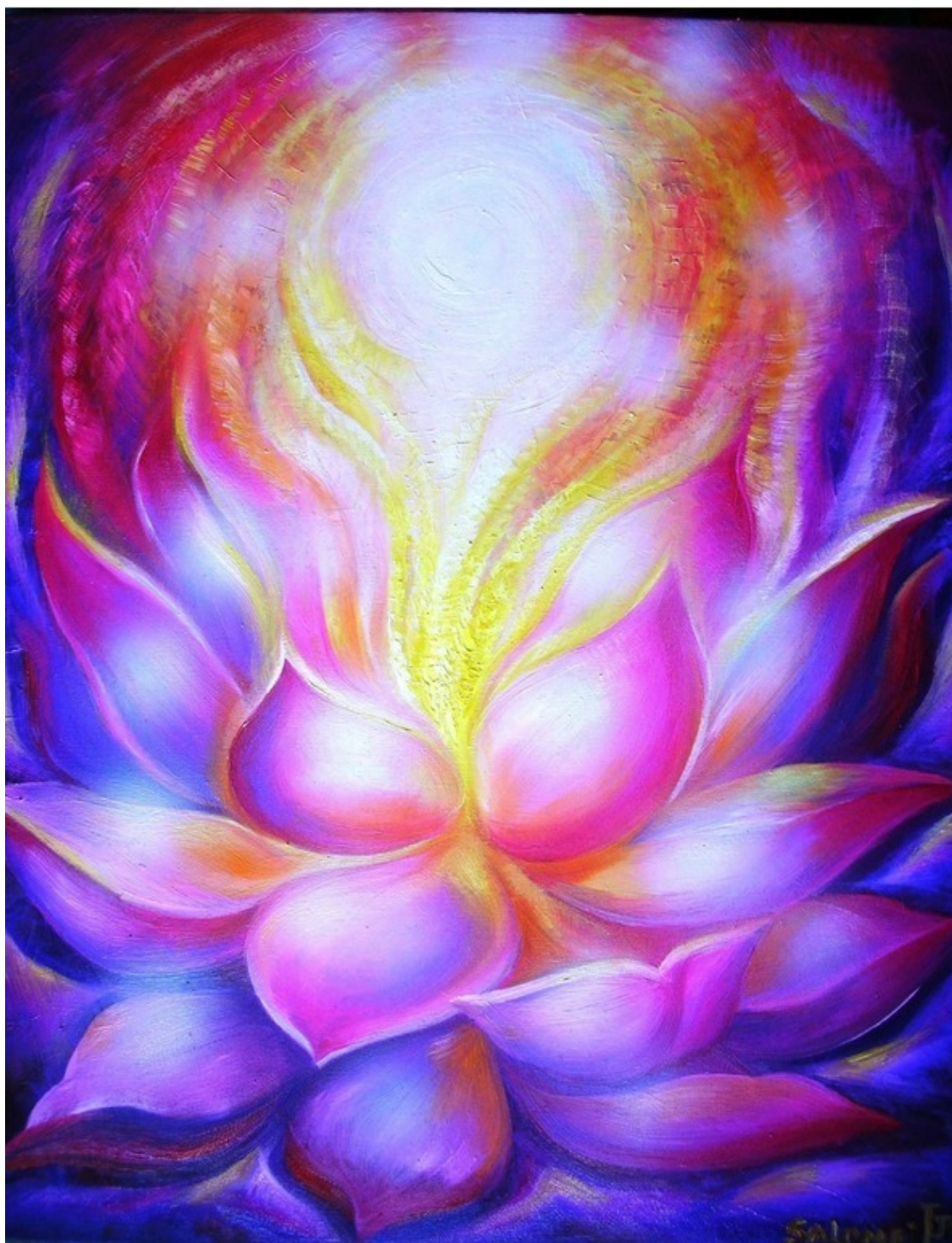
Цветок первой любви. Эзотерическая картина художника Юлии Лагус