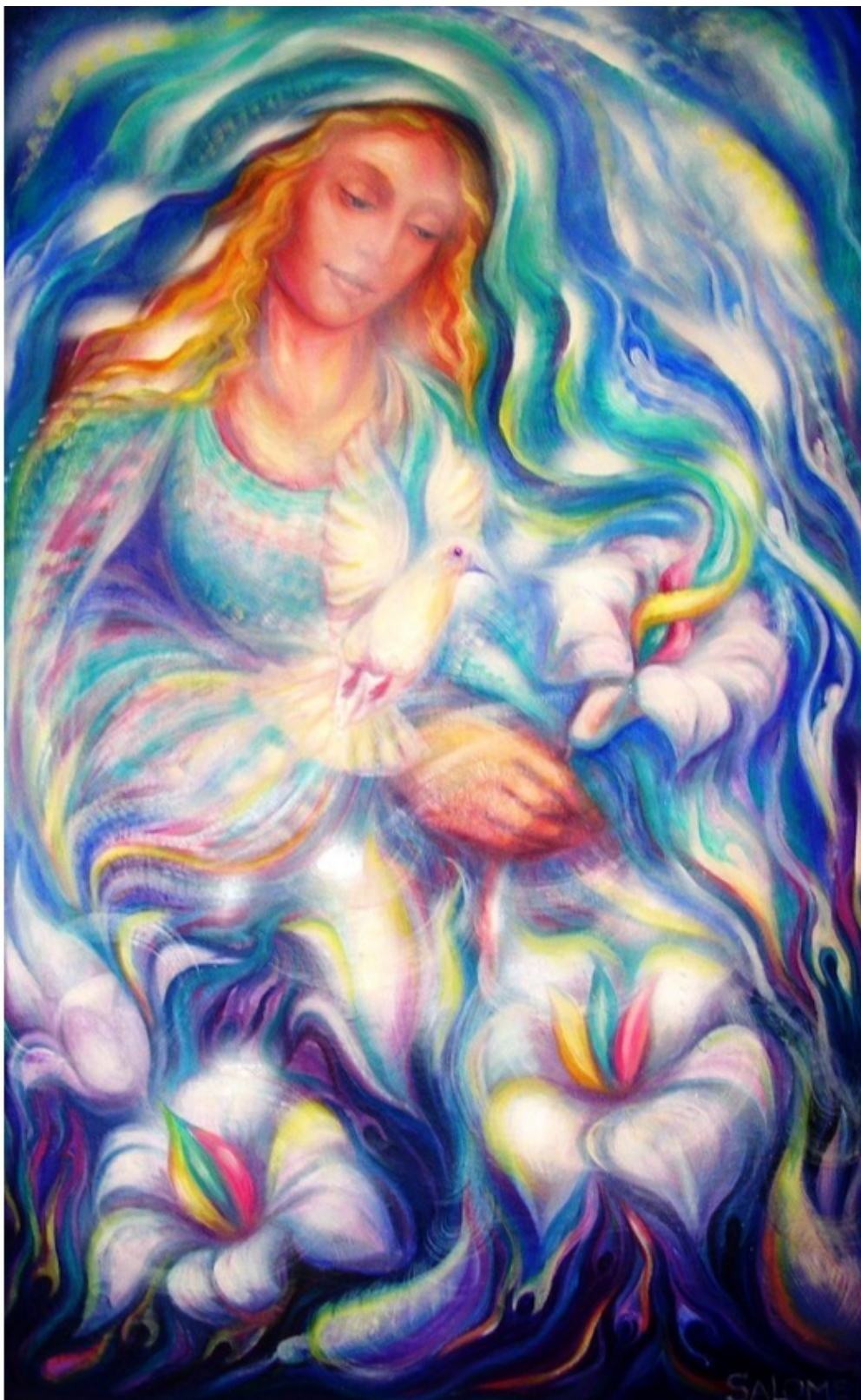
Божественная Мать. Женская энергия усиливается на нашей планете, наполняя своей любовью всё сущее, призывая к миру и гармонии. Эзотерическая картина Юлии Лагус.