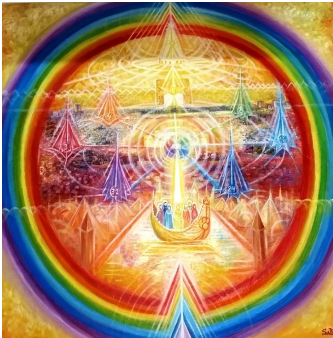
Город из лучей и врата в него. Эзотерическая картина Юлии Лагус.