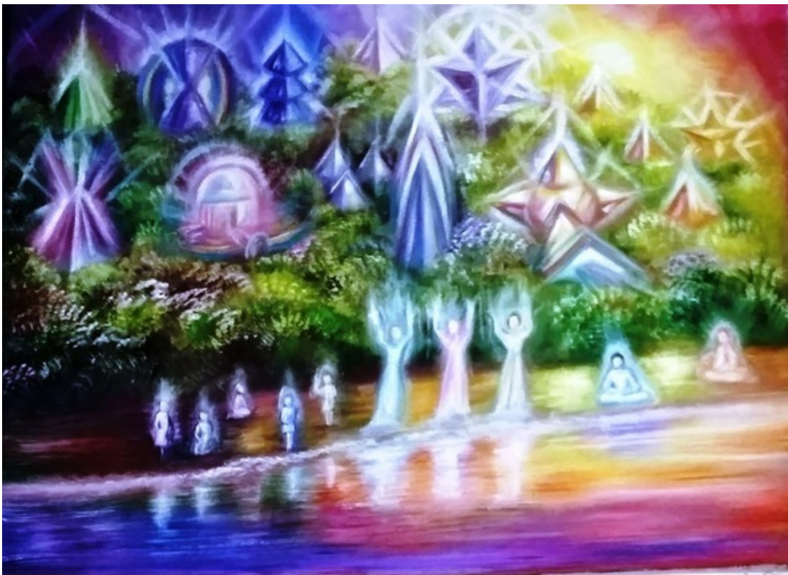
Эзотерическая картина Юлии Лагус