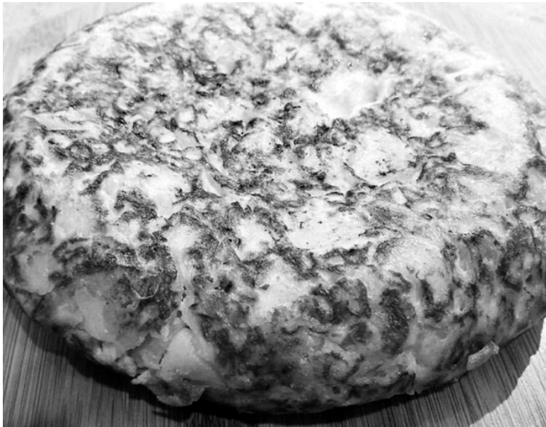
Испанская тортилья, стр. 18