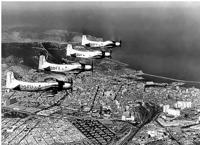
Самолеты «Скайрейдер» над Алжиром

руководителей ФНО Белькасим Крим, обращаясь к своим сторонникам, подчеркнул: «Ваша борьба вынудила врага говорить о самоопределении, отказываясь от мифа о французском Алжире». С этого момента подполье прекратило все явные военные операции, дабы продемонстрировать миру, что ФНО остался непобеждённым. На международной арене началась активная пропаганда поддержки Алжира в борьбе за самоопределение, а агитаторы ФНО осуждали действия французов в колонии, пытаясь посеять раздор между Францией и её союзниками.