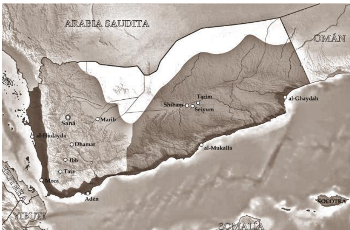
Город-порт Мокко (по-европейски – Мокка)

Кофейные деревья быстро прижились в благоприятных климатических и почвенных условиях Йемена, и в IX в. в районе города-порта в южной части Красного моря Порт-эль-Араб (более известный как Моча или Аль-Моча) арабы продолжили экспериментировать с кофейными ягодами – попробовали извлекать из ягод, высушивать и варить сами зерна. Созданный напиток арабы называли «qahwah» («кахва»), что дословно переводилось, как «настой, мешающий заснуть», обозначающий напиток из забродившей пульпы кофейных ягод. Это вторая версия происхождения названия «кофе». Иноземные купцы называли город Мокко (по-европейски – Мокка).