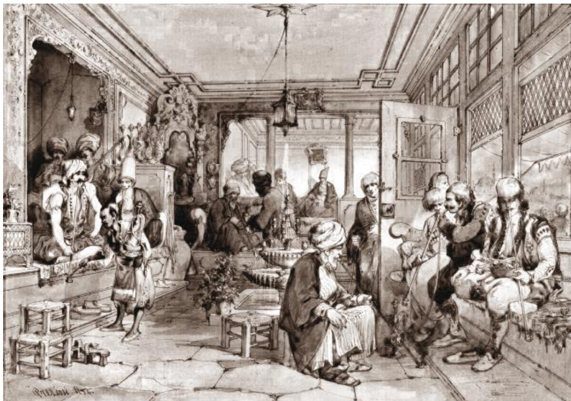
Арабские кофейни (иллюстрация из открытых источников)