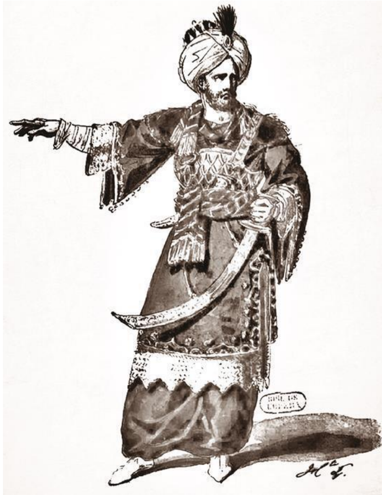
Мехмед II Фатих (Завоеватель)