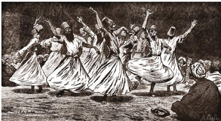
Танцующие суфии

отдаленные братства, а жидкость выпивали, как тонизирующий напиток. Суфии, adeпты мистического мусульманского учения, стали употреблять его регулярно. Суфии редко посвящали себя только молитвам (как принято ошибочно думать). Как большинство верующих, они занимались повседневной работой. Свои задачи они решали, проводя поздно вечером обряды, во время которых впадали в особое состояние транса, возносясь над миром. Для приготовления отвара они высушивали на солнце спелые ягоды и настаивали их в горячей воде. Отвар помогал суфиям бодрствовать и заменял традиционный для Йемена стимулятор – листья кустарника кат.