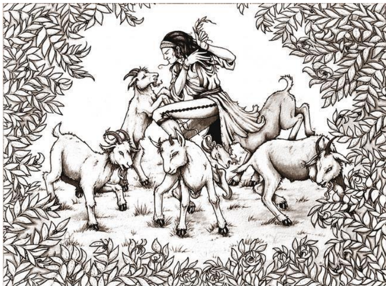
Пастух Калдим и его козы (иллюстрация из открытых

ной с вишню, в результате чего животные преобразались и были излишне возбуждены (игриво скакали, прыгали и почти танцевали). И по легенде все это произошло в IX столетии. Хотя эта история почти наверняка является апокрифом, однако большинство письменных источников сходится на том, что люди впервые начали использовать кофе, как продукт, именно в Эфиопии, а уже вскоре после X века кофе перевезли через Красное море на территорию современного Йемена, который в те времена назывался «Счастливая Аравия».