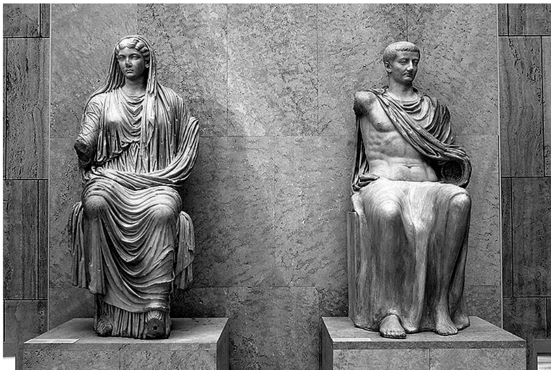
Ливия Друзилла и Тиберий. Римские статуи I века н.э.

Тиберий был сыном Ливии Друзиллы, которую полюбил император Август, несмотря на то, что она была замужем и ждала ребёнка; Скрибония, жена Августа, тоже была беременной в это время. В день рождения своей дочери Август развелся с женой и женился на Ливии, заставив её мужа развестись с ней. Таким образом, её старший сын Тиберий и только что родившийся Друз стали пасынками Августа.