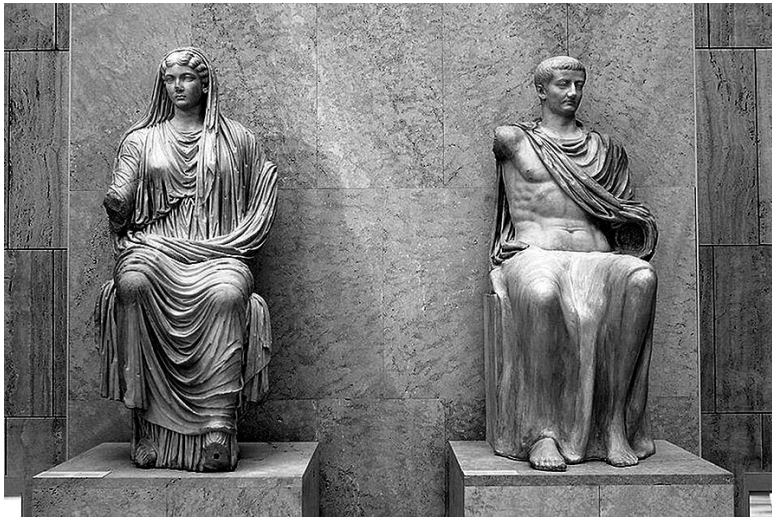
Ливия Друзилла и Тиберий. Римские статуи I века н.э.

Тиберий был сыном Ливии Друзиллы, которую полюбил император Август, несмотря на то, что она была замужем и ждала ребёнка; Скрибония, жена Августа, тоже была беременной в это время. В день рождения своей дочери Август развелся с женой и женился на Ливии, заставив её мужа развестись с ней. Таким образом, её старший сын Тиберий и только что родившийся Друз стали пасынками Августа.