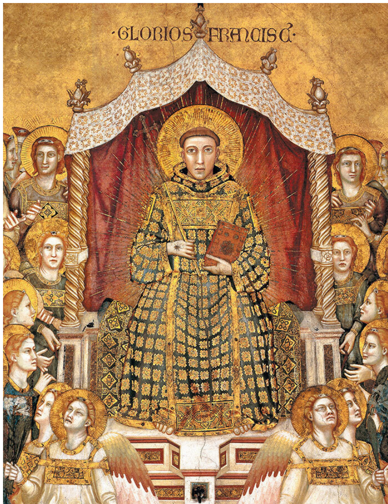
Св. Франциск Ассизский. Фрагмент фрески Джотто.