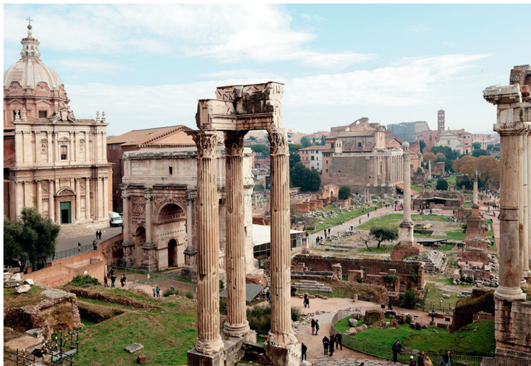
Рим. Форум Романум

да Сангалло, над ним будут думать Браманте и Леонардо, в 1551 году его опубликует и проиллюстрирует Фра Джокондо. Идея связи макро- и микрокосма найдет конкретное выражение в антропоморфном характере архитектуры, в установлении гармонических соотношений с пропорциями человека» 46 . Уже на закате эпохи Возрождения трактатом Витрувия будут вдохновляться Виньола и Палладио, а комментировать его станут и ученые, и дилетанты.