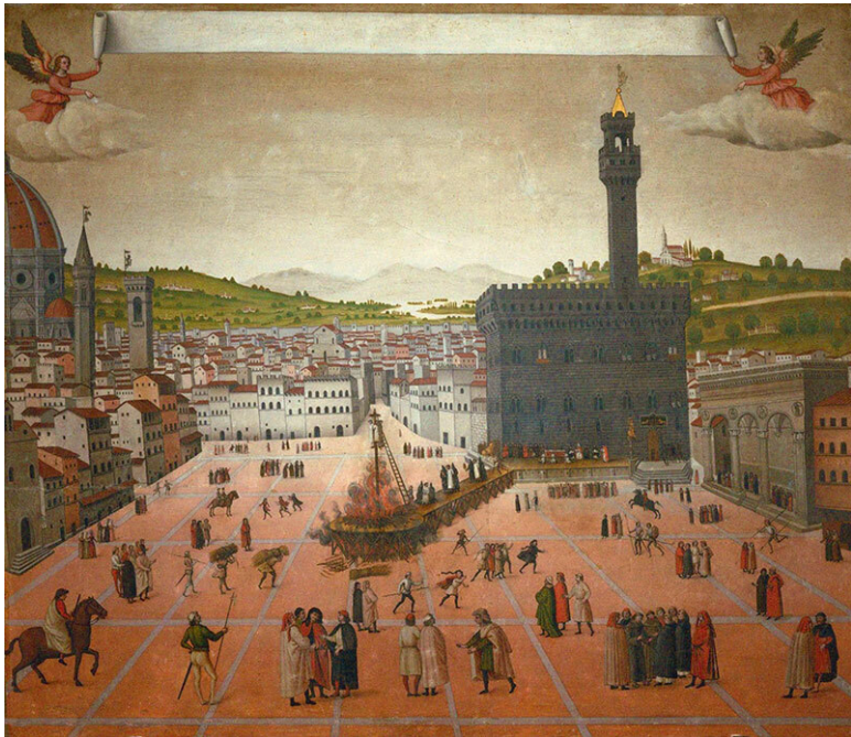
Сожжение Савонаролы. Картина неизвестного художника. 1498

И вновь приходится удивляться тому, как этой стране, истерзанной войнами, восстаниями, предательствами и лихоимством, невзирая на все лишения, удалось создать великую ренессансную культуру. Но этот факт стал достоянием истории, и в нем мы вправе, вероятно, видеть одно из самых ярких воплощений органически присущего людям стремления