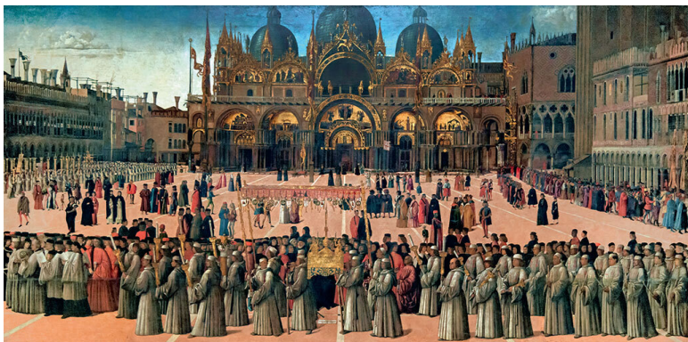
Процессия с реликвией Св. Креста на площади Св. Марка в Венеции. Картина Джентиле Беллини. 1496

Напряженность, создававшаяся в городском сообществе социальным расслоением, усиливалась еще и из-за политических разногласий. В итальянских городах-государствах существовали две крупные политические партии – гвельфов и гибеллинов, объединявшие сторонников соответственно папы и императора. Однако разницей в политических предпочтениях партии не ограничивались; опорой им служили все-таки разные социальные слои: крупные феодалы – для гибеллинов, городские пополаны (нередко в союзе с рыцарями-нобилями) – для гвельфов. Неудивительно, что гвельфы и гибеллины всегда находились в состоянии острого соперничества, часто переходившего в открытую вооруженную борьбу. Но и в рядах одной партии нередко возникали противоре-