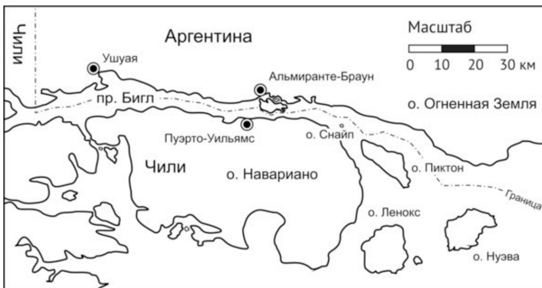
Пролив Бигл, архипелаг Огненная Земля