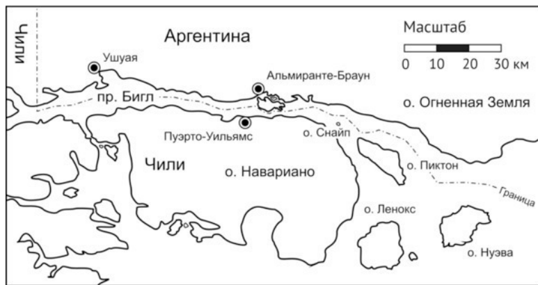
Пролив Бигл, архипелаг Огненная Земля

сти. Окончательное решение арбитража должно было быть представлено британской королеве, которая в свою очередь рекомендовала бы принятие или отклонение этого решения, не изменяя его. Вердикт был оглашен в 1977 году: все три спорных острова и прилежащие к ним воды принадлежат Чили. Аргентина, чьи претензии оказались отвергнуты, решением арбитража не удовлетворилась и предложила Чили снова вернуться к двухстороннему формату переговоров. Чилийцы согласились. К этому времени в обеих странах пришли к власти военные хунты во главе с генералами Аугусто Пиночетом и Хорхе Виделлой. Однако даже личная встреча двух диктаторов в январе 1978 года не помогла урегулировать спор.