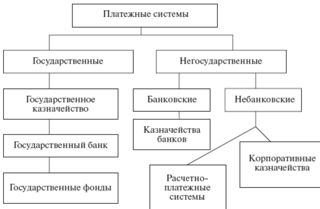
Рис. 1.1. Классификация платежных систем

Современная экономика любого государства представляет собой широко разветвленную сеть сложных отношений между входящими в нее хозяйствующими субъектами. Хорошо отлаженная платежная система играет ключевую роль в развитии межбанковских денежных рынков и рынков ценных бумаг.