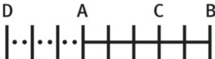
Числовая прямая Джона Валлиса

Иными словами, это положительное число наоборот. По сути, так бы сказали и мы. В качестве “физического приложения” он измеряет расстояние по прямой от заданной точки, а затем обратно – и дальше. Он спрашивает, как далеко от стартовой позиции окажется человек, если отойдет на 5 ярдов от точки А, а затем вернется на 8 ярдов назад. Он получает ответ – 3, который, несомненно, дали бы и вы.