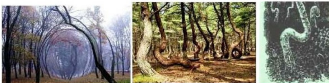
Фото 2. Искривления стволов деревьев в аномальных зонах – Санта-Круз, Медведицкая гряда и Заколдованной роще-Лесочек

Санта-Круз, США. Это действие на искривления стволов гравитационным полем Земли в виде воронки диаметром 50 метров. На первом фото слева показано его действие на рост деревьев в этой зоне. Здесь и вода течет и даже камни катятся не вниз, а вверх.