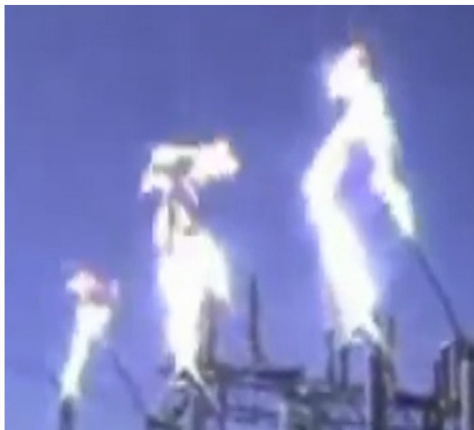
Фото 3. Выброс белого газоподобного облака-пламени из зёрен-электропотенциалов при коммутации-отключения высоковольтных линий электропередач.

может быть и полупрозрачным, и мерцающе светящимся, и подобно эманации «белого пламени» в зависимости от плотности концентрации разделённых друг от друга зёрен-электропотенциалов из вещества кластера.