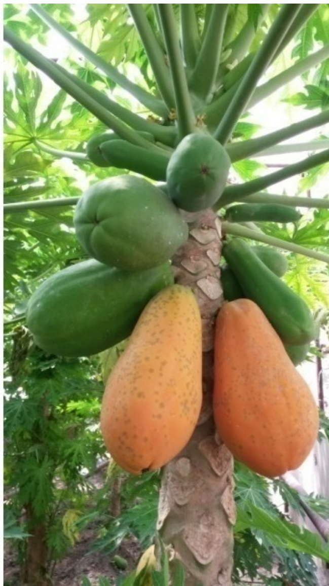
Спелые и не дозревшие плоды дынного дерева