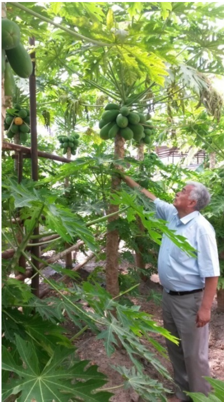
Рост дынного дерева