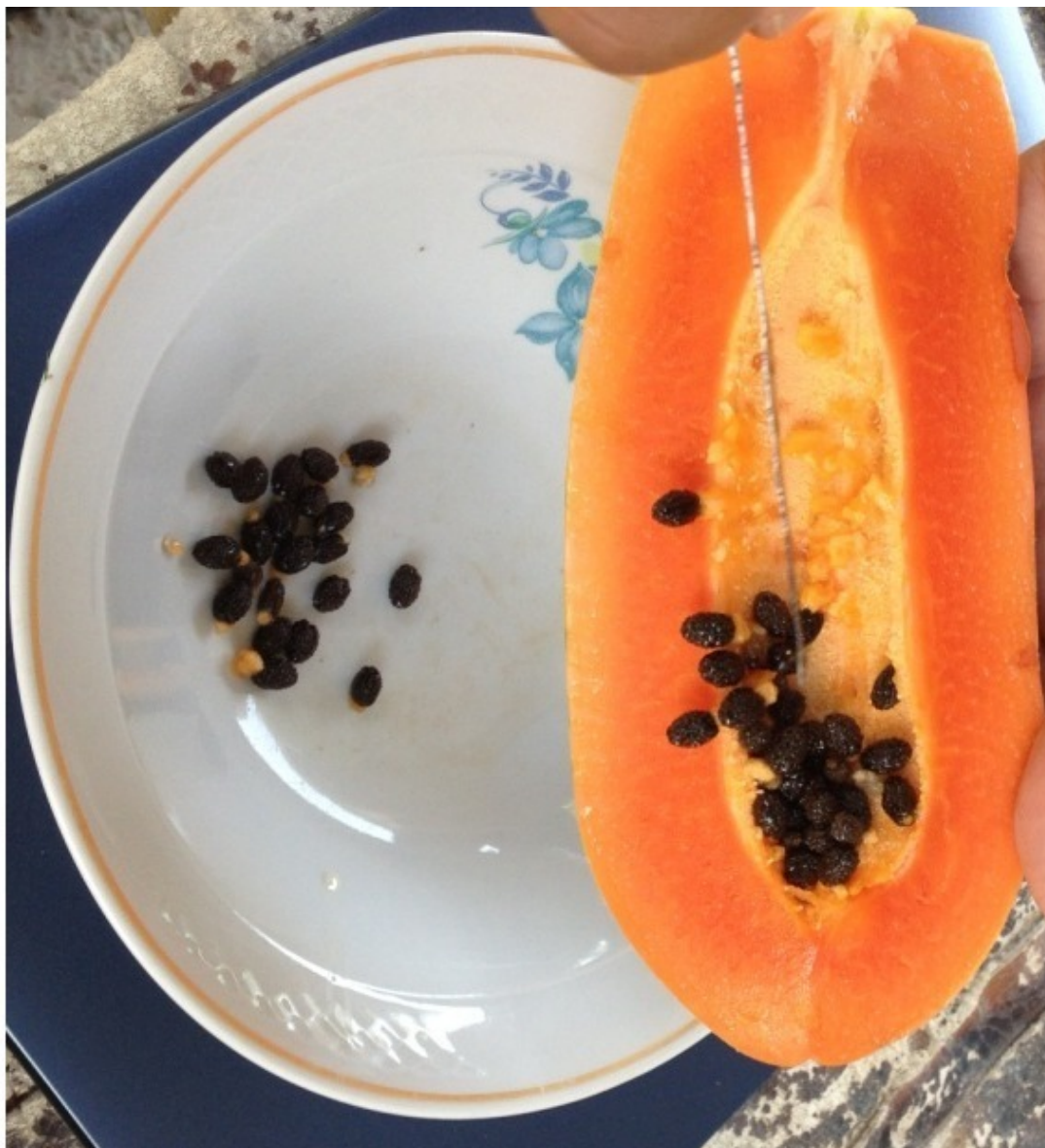
Семена плода дынного дерева

Ареал распространения: родиной папайи является юг Мексики, Центральная Америка и север Южной Америки. Сегодня дерево папайи выращивают во всех тропических странах как фруктовое дерево: Бразилии, Бангладеш, Индии, Индонезии, Пакистане, Шри-Ланке, Вьетнаме, Филиппинах и Ямайке. Папайя очень любит тепло и влажность, поэтому за пределами тропиков выращивать её очень сложно. Папайя – одно из важнейших плодовых растений тропической зоны. Его плоды ежедневно употребляют миллионы людей. В диком виде встречается в тропической Америке и Азии. Дынное дерево дуболистное Carica quercifolia Solms. , которое имеет более мелкие плоды, может культивироваться в субтропиках [1.6]. Мировые страны производители дынного дерева на 2011 г. приведены в таблице 1.1.