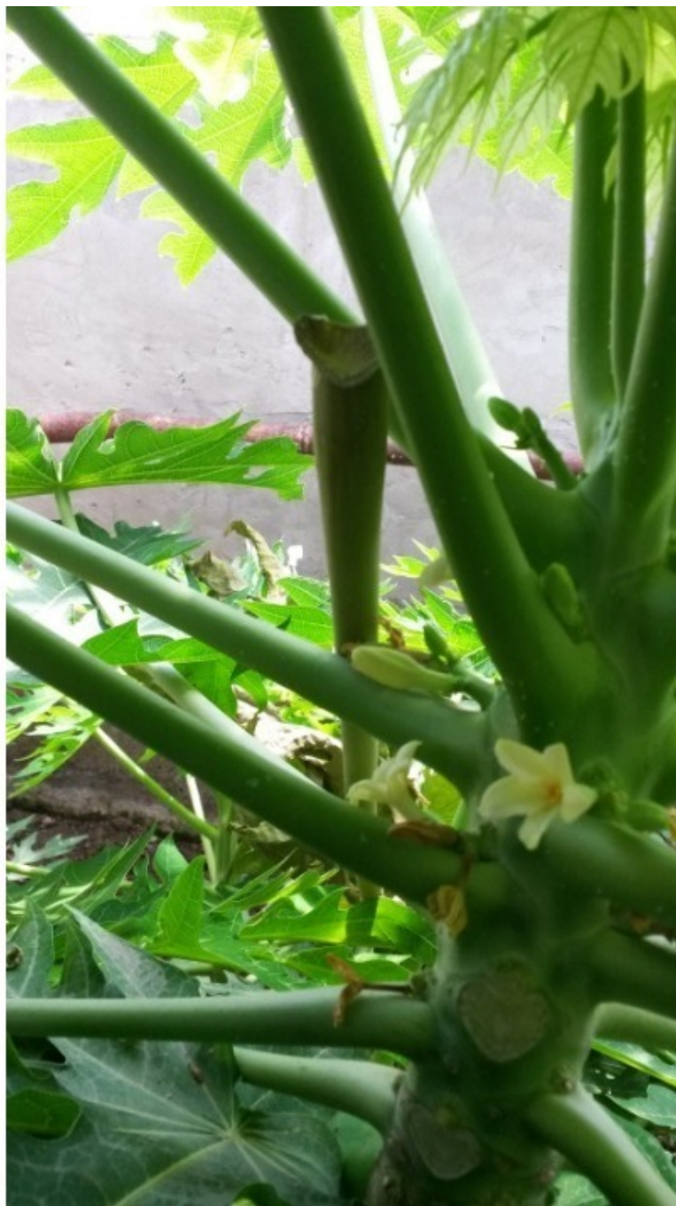
Цветочки дынного дерева