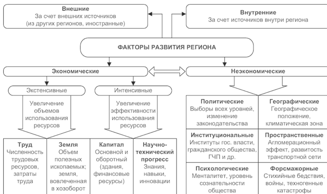
Рисунок 1. Классификация факторов развития региона.

В общем виде факторы, оказывающие влияние на развитие региона, можно классифицировать на экономические и неэкономические (рис. 1). Источники данных факторов могут быть внутренними и внешними.