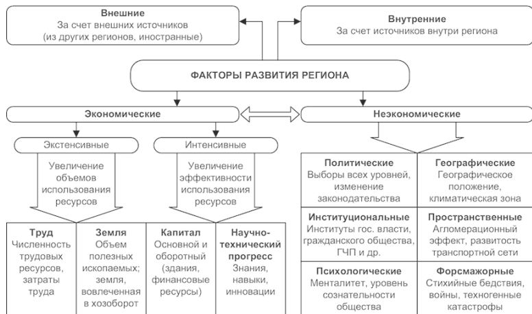
Рисунок 1. Классификация факторов развития региона.

В общем виде факторы, оказывающие влияние на развитие региона, можно классифицировать на экономические и неэкономические (рис. 1). Источники данных факторов могут быть внутренними и внешними.