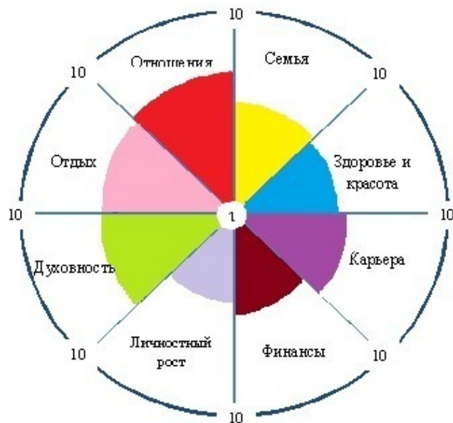
Рис.2. Пример «колеса» жизненного баланса