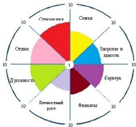
Рис.2. Пример «колеса» жизненного баланса