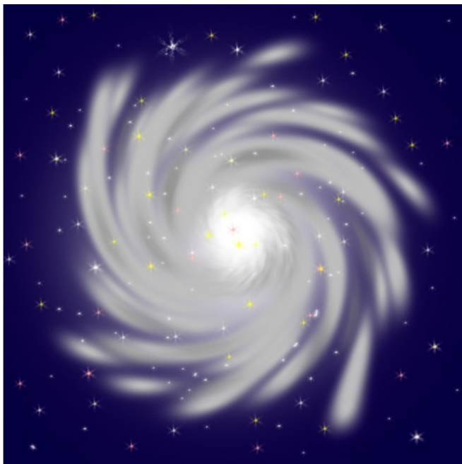
Рисунок 2. Галактическое метавихрение.

Пространство вселенной можно охарактеризовать как бесконечно протяжённое, не имеющее границ . Скопления эфирных шариков в этом бесконечном пространстве не являются сплошной средой, они напоминают облака. Га-