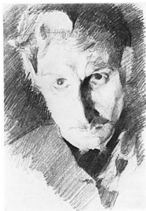
художник М. А. Врубель

лучшем смысле этого слова) здорового образа жизни, обязательно постоянное обучение детей с самого раннего возраста в детских садах и школах культуре здоровья, в том числе и культуре здорового питания. Это и будет самой эффективной и действенной профилактикой депрессии, да и множества других болезней. Хочется надеяться, что эта книга внесет свою скромную лепту в помощь людям, страдающим депрессией.