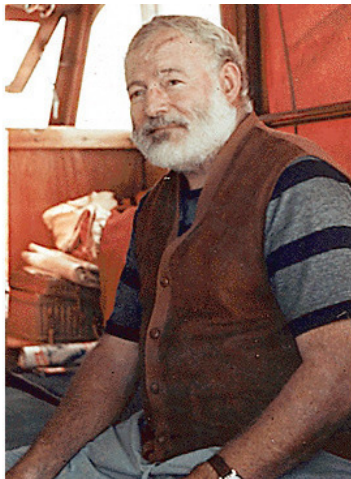
писатель Эрнст Хемингуей