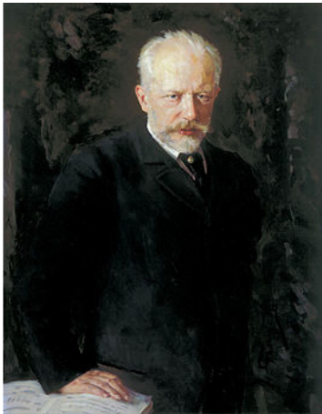
композитор П. И. Чайковский