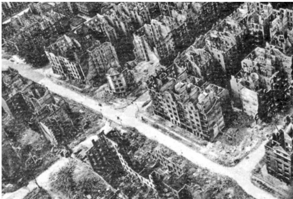
Разрушенный Гамбург после налета англо-американской авиации

Противовоздушная оборона Рейха, в которую входили ночные истребители генерала Каммхубера, не могла заставить англичан и американцев платить слишком высокую цену за эти налеты. Но они сражались, эти ребята, как герои, дрались храбро, отправляя к земле при каждом налете десятки вражеских бомбардировщиков. И основной боевой машиной защитников ночного неба Германии был его тяжелый истребитель Me-110, которому он отдал огромное количество своих нервов и сил.