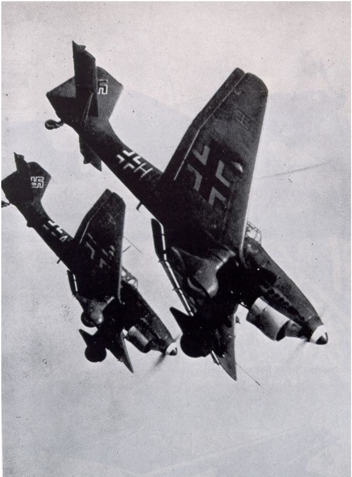
Атакуют пикировщики Ю-87

Но и его «мессеры», расчистив небо от уцелевших после первого удара истребителей противника, приняли активное участие в штурмовках наземных войск. Через месяц с небольшим Франция была повержена, англичане эвакуировали морем свои экспедиционные силы из Дюнкерка, Бельгия капитулировала.