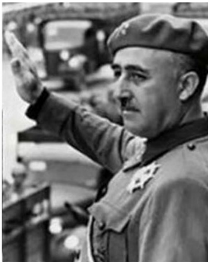
Генерал Франсиско Франко

Обкатку в горячем испанском небе прошло 130 истребителей Вф-109, но лишь 21 из них был потерян в воздушных боях. Вилли осознал, что именно благодаря его «сто девятым» произошел коренной перелом в противостоянии республиканцев и франкистов в воздухе, и был немало этому рад. Он не любил «красных», которые, получив власть, устроили в Испании хаос и террор, привели ее к экономической катастрофе. В стране происходили грабежи и массовые зверские убийства, «красные» сжигали церкви вместе со священниками и прихожанами. Во имя какой-то мифической высшей справедливости они отнимали у людей их собственность, зачастую вместе с жизнями. Кто-то должен был положить конец этой кровавой вакханалии, и это сделали военные. Одержав победу, генерал Франко перестрелял и перевешал наиболее активно зверствовавших «красных», менее виновных посадил для перевоспитания в тюрьмы, и в истерзанной стране воцарились мир и спокойствие.