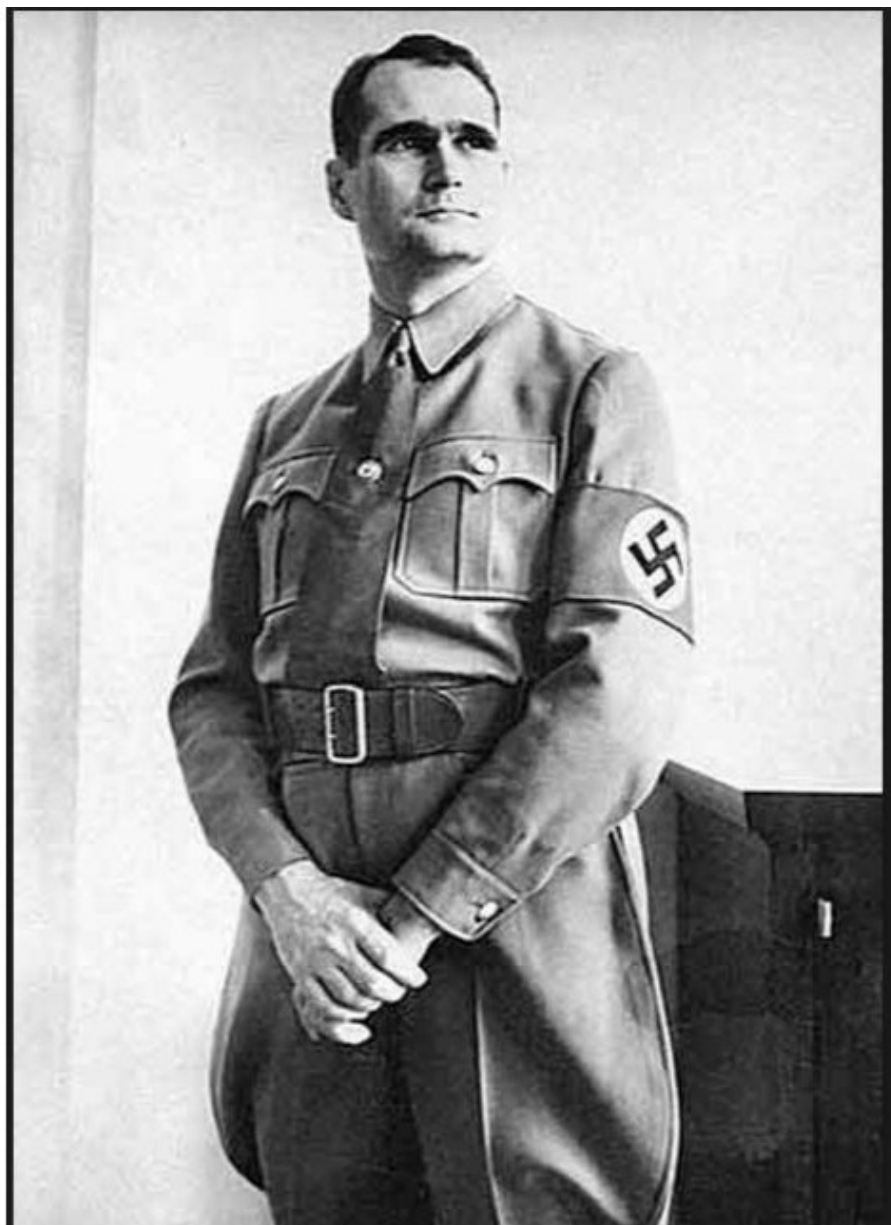
Заместитель фюрера по партии Рудольф Гесс

– Как вы думаете, какова была истинная причина поступка Гесса? – вновь спросил британский полковник.