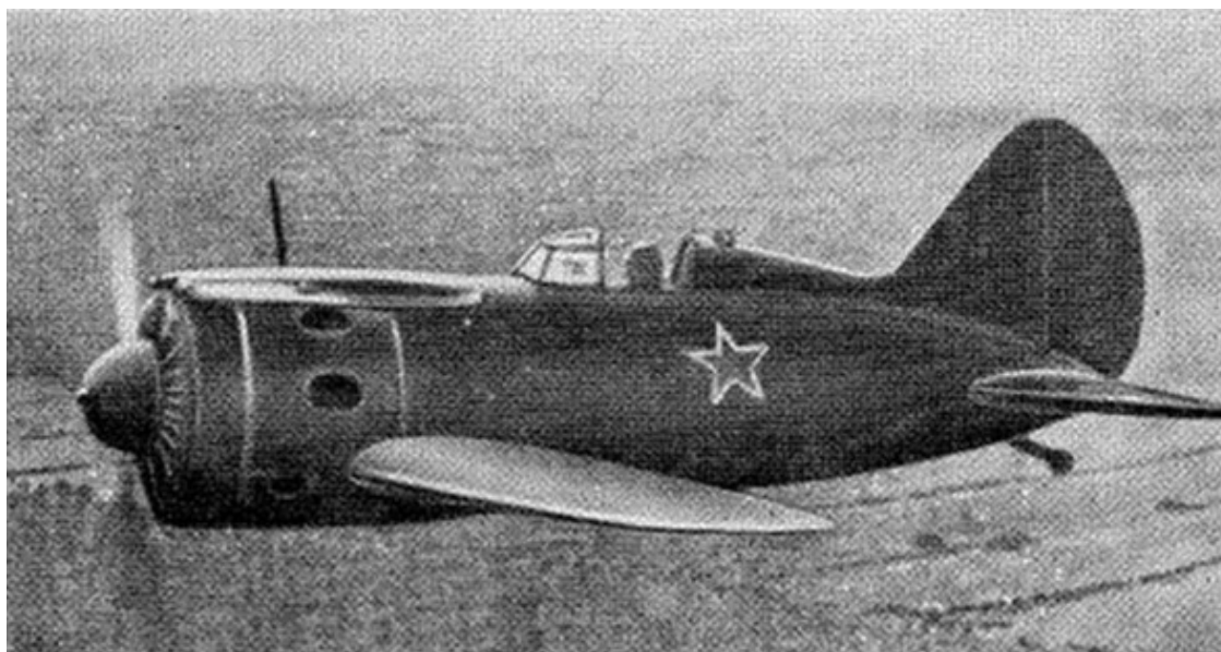
Советский истребитель И-16

Вилли окончательно понял, что Тео прав, и лучших условий опытной эксплуатации для его машин трудно было придумать. И вообще это очень заманчиво – сразиться в воздухе с юркими тупоносыми И-16, «крысами», как их прозвали немецкие летчики. Высокая скорость «сто девятого» должна была обеспечить ему преимущество в бою с русскими истребителями.