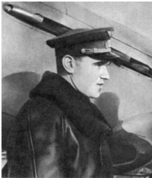
Советский авиаконструктор Александр Яковлев

вала разведка, устроил на своих заводах, производящих фронтовые истребители «Як», многое по образу и подобию заводов Мессершмитта. Тот же порядок в производственных помещениях, пунктуальность, строгий режим, четкость в доставке комплектующих, рабочие и технологи в чистой спецодежде.