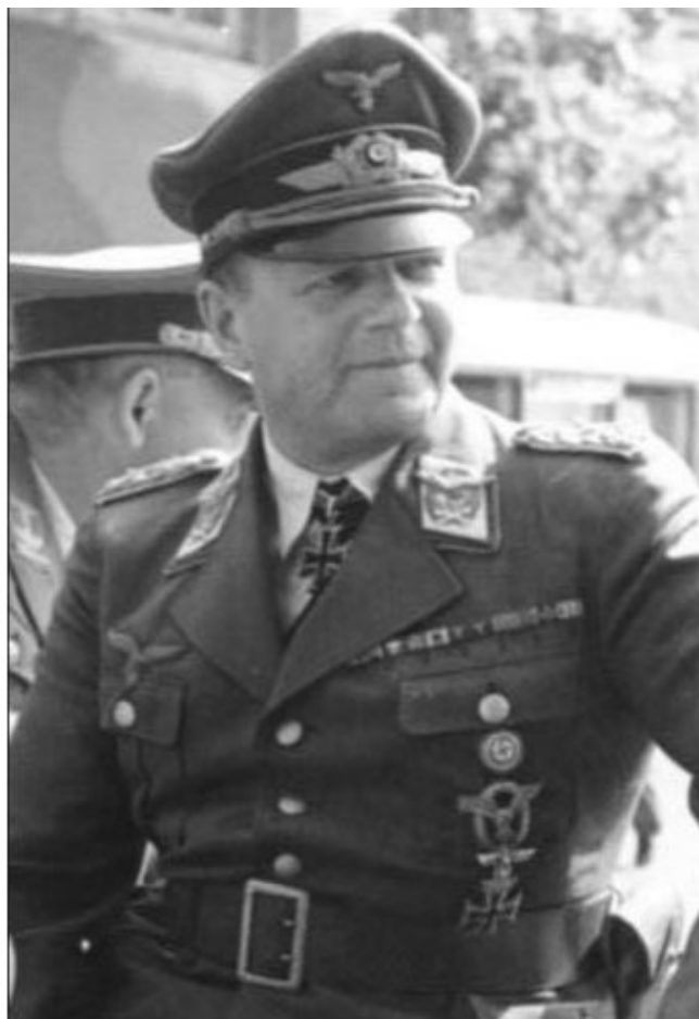
Фельдмаршал Эрхард Мильх

Вот и тогда, в марте 1934-го, Вилли совершенно случайно узнал от одного знакомого офицера из Технического Управления Министерства авиации, что техническое задание на новый истребитель проклятый Мильх уже разослал его конкурентам, а его, Мессершмитта, проигнорировал самым возмутительным образом. Когда он рассказал об этом Лилли, она пришла в ярость и потребовала, чтобы он немедленно позвонил Гессу. Вилли так и сделал. В разговоре с ним Рудольф Гесс был доброжелателен и спокоен. Он сказал, чтобы Мессершмитт не беспокоился, и пообещал, что сделает все возможное, чтобы восстановить попорченную справедливость. И буквально на следующий день Вилли позвонили на завод из Министерства авиации и пригласили его приехать в Берлин. Гесс, действительно, все уладил. С Мессершмиттом говорили подчеркнуто вежливо.