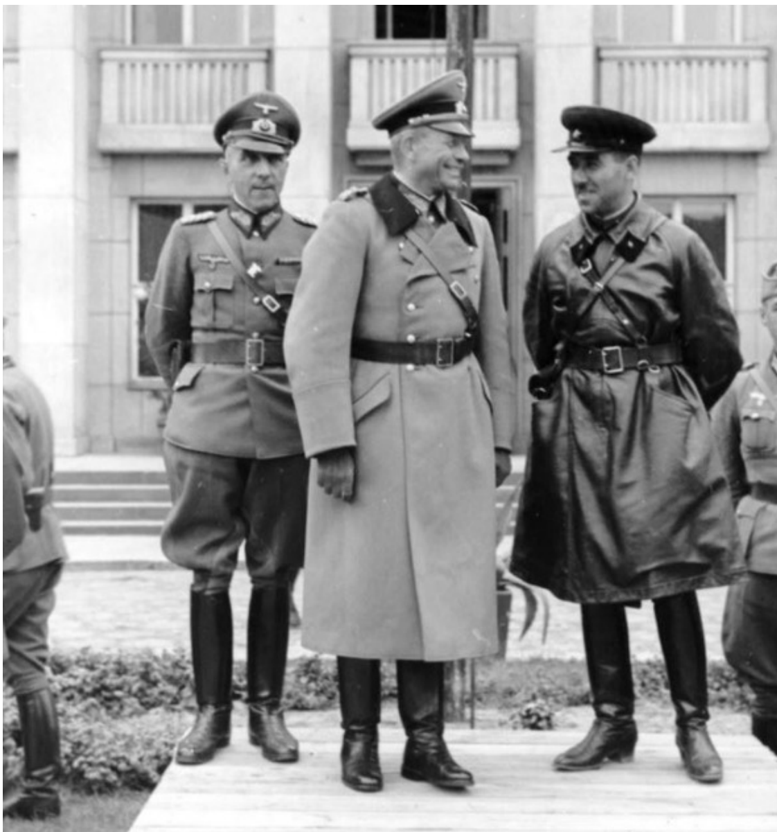
Генерал Гудериан и комбриг Кривошеин во время передачи города Брест-Литовска (ныне г. Брест, Белоруссия) частям РККА. Слева – генерал Мориц фон Викторин.

Польша была обречена, но войну Германии объявили Англия и Франция, и уже 8 сентября французские истребители на американских самолетах «Хок» -75 сббили два Vf-109D. Это были первые потери «сто девярых» во Второй мировой войне. До этого их сббвали только русские в Испании. С Польшей разделались к 8 октября. Многие польские летчики-истреби-тели бежали в Румынию, а оттуда в Англию, чтобы потом сводить счеты с немцами, сража-ясь на «спитфайрах» в составе Королевских ВВС. Война с Польшей была классической «мол-ниеносной войной», о которой так любил рассуждать Гитлер. А затем настала очередь Дании, Норвегии и Франции.