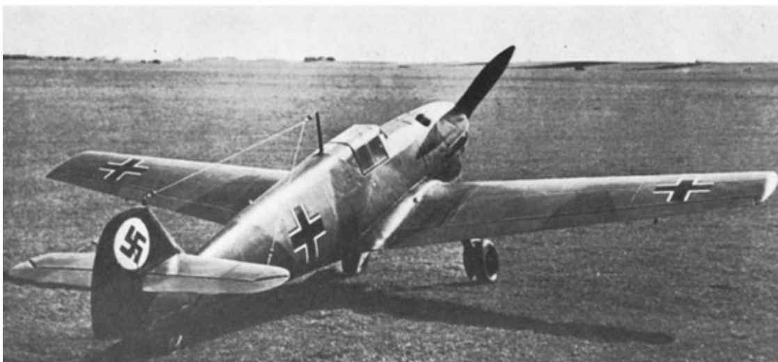
Первый серийный Vf-109 В-1