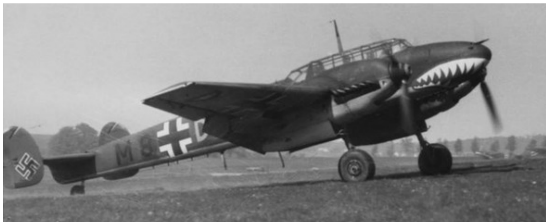
Тяжелый истребитель Me-110

пулеметом, внутренней подвеской бомб и двухместной кабиной экипажа. Вместо одного киля самолет после долгих колебаний конструкторов был снабжен раздвоенным килем с двумя шайбами на концах, чтобы стрелок-радист мог беспрепятственно вести огонь назад. Благодаря раздвоенному хвосту, во время войны с СССР его «сто десятый» часто путали в воздухе с русским пикировщиком Пе-2 конструкции Петлякова. В носовой части фюзеляжа Вилли решил установить целую батарею из шести неподвижных пулеметов. Когда дело дошло до серийного выпуска, самолет был вооружен четырьмя пулеметами в носу, двумя авиационными пушками калибра 20 мм и подвижным пулеметом стрелка-радиста для защиты от истребителей врага задней полусферы.