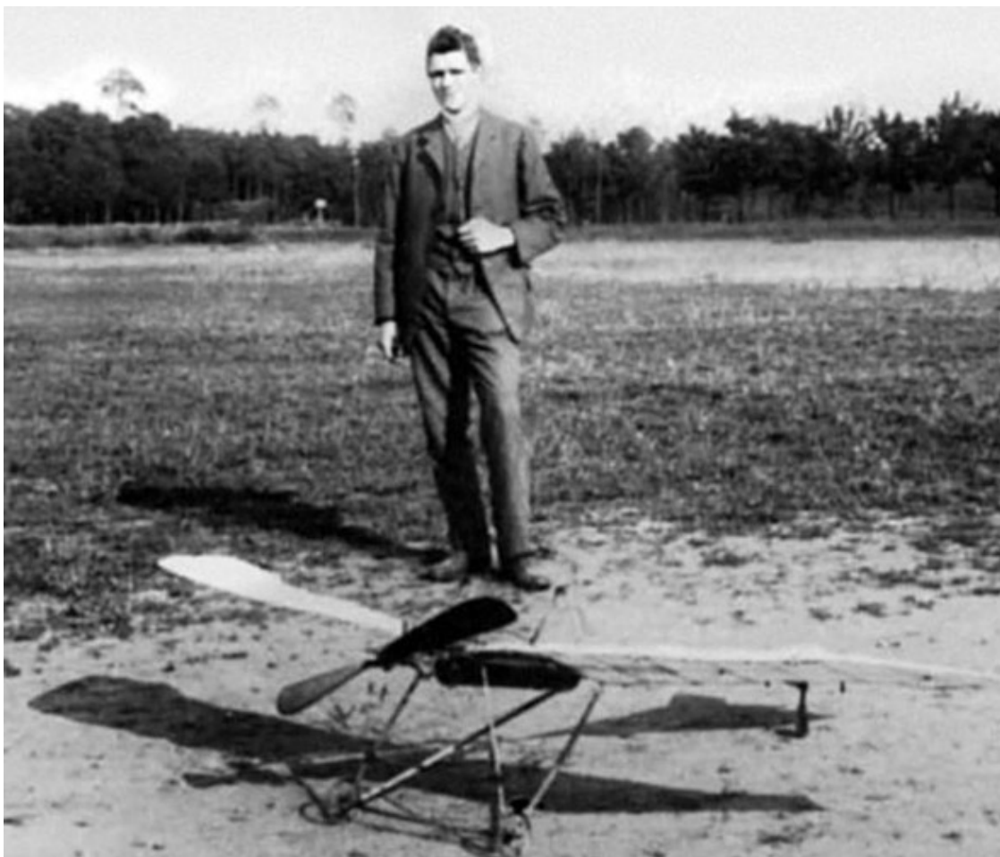
Юный Вилли Мессершмитт в Бамберге