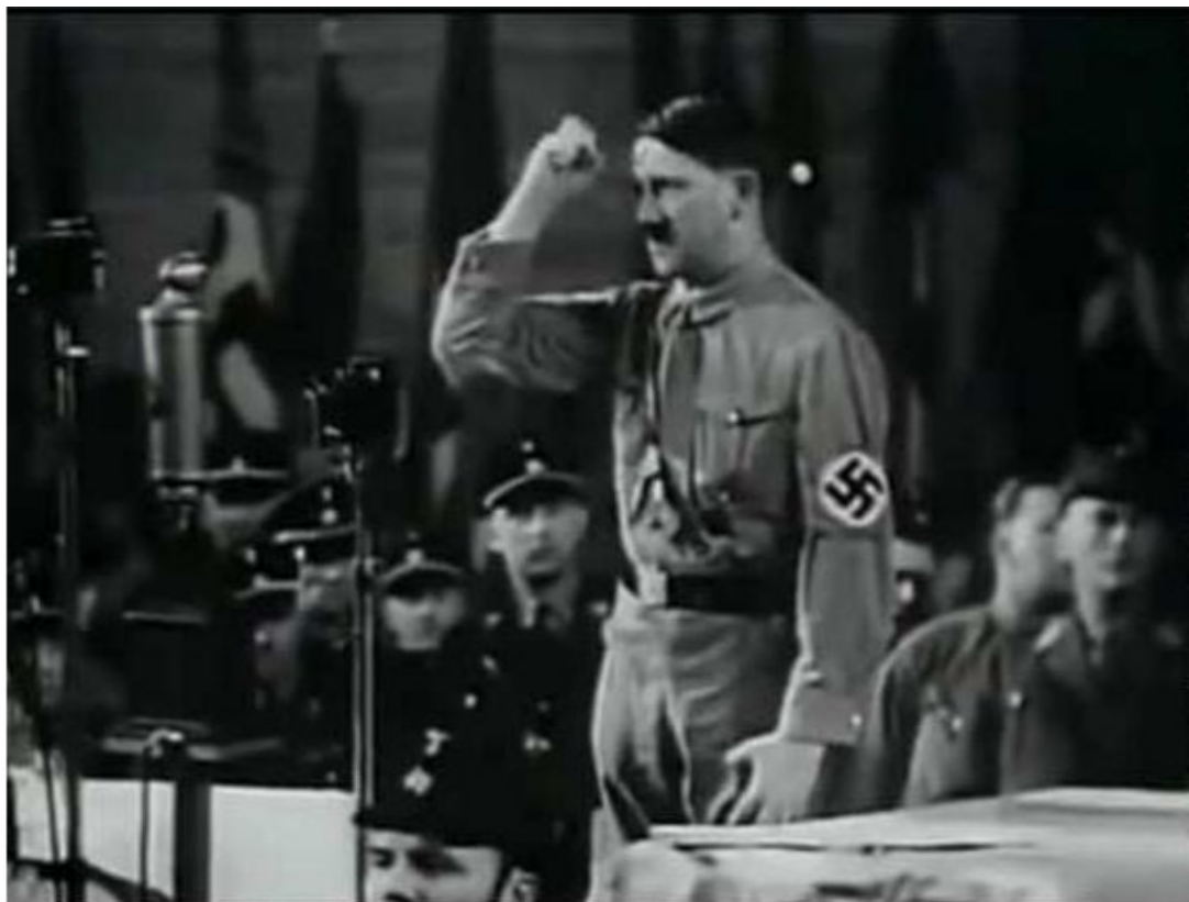
Выступление Гитлера в Мюнхене