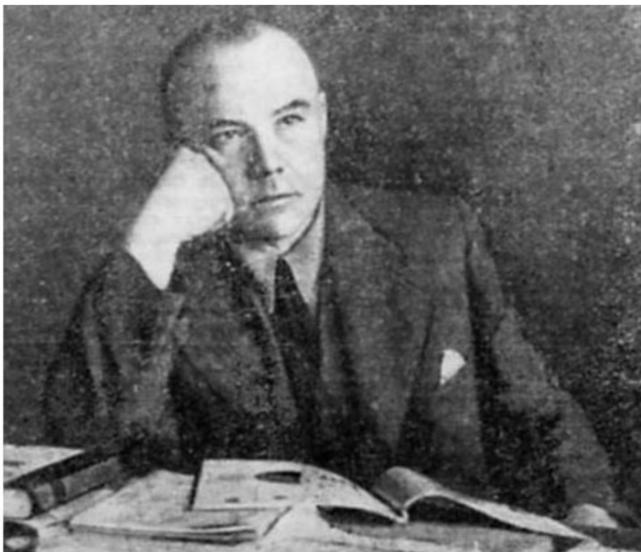
Советский авиаконструктор Николай Поликарпов