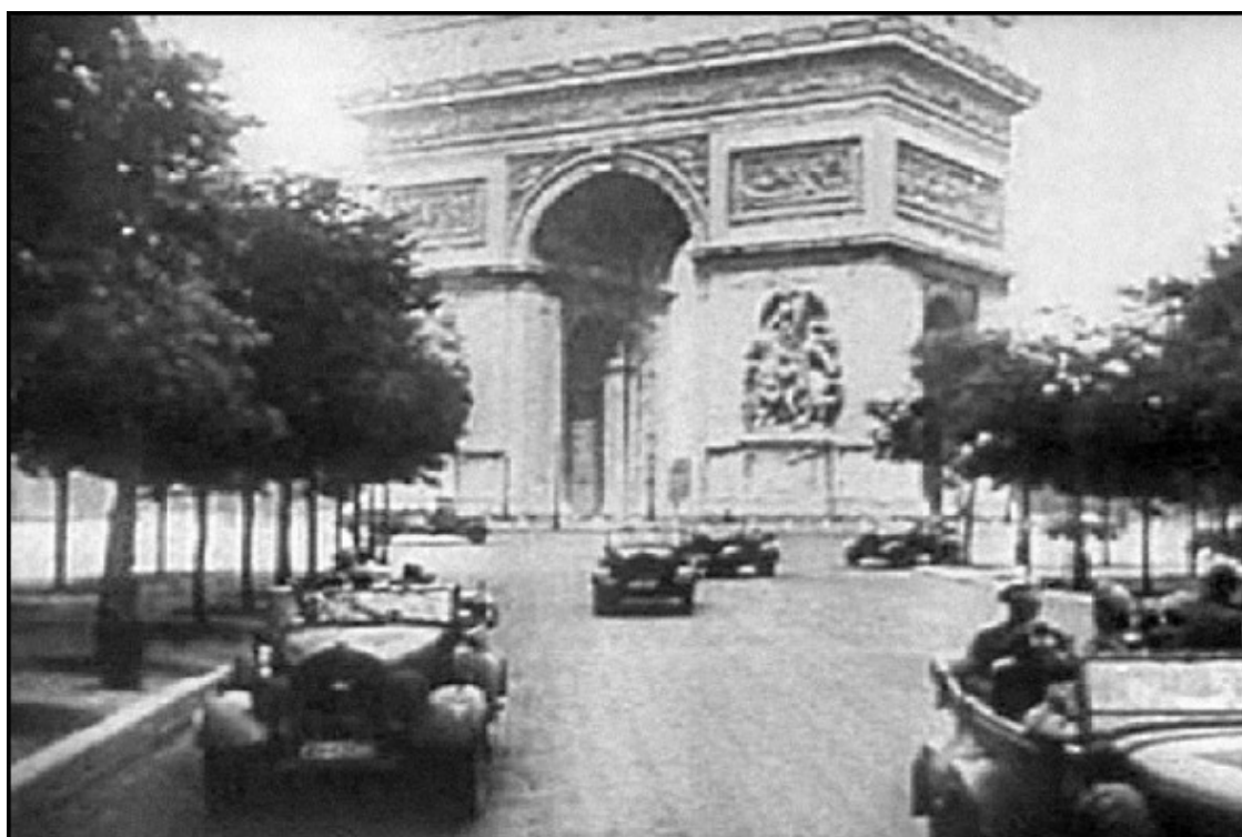
Парад нацистов в Париже