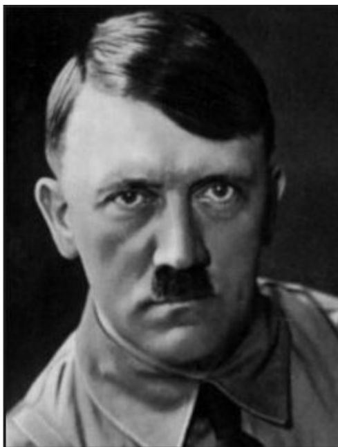
Адольф Гитлер в начале 30-х годов