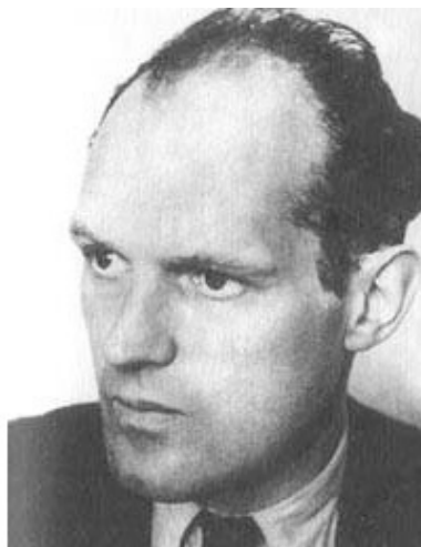
Авиаконструктор Вилли Мессершмитт

Союзники вошли в Обераммергау 29 апреля, и Мессершмитт ждал их визита со дня на день. До самого последнего дня в деревишке работал замаскированный комплекс проектирования и производства боевых самолетов. Компания «Мессершмитт АГ» продолжала выпускать истребители Me-109-G, получившие прозвище «Густав», истребители-бомбардировщики Me-110, новейшие реактивные Me-262 в варианте истребителей. Свирепые бомбардировки союзной авиации уничтожали крупные авиационные заводы, но производство пряталось в лесах и под землей и продолжало выпускать боевые самолеты и реактивные снаряды «Фау». По всей захваченной территории Германии неустанно рыскали группы переодетых в военную форму технических специалистов и искали спрятанные авиационные и ракетные заводы. На западе их искали англичане и американцы, на востоке – русские. И они находили – в лесах, в подземных туннелях и бункерах – находили в таких местах, о которых даже не подозревала военная разведка. Все найденные трофеи – техническая документация, чертежи, опытные образцы новейшего вооружения – немедленно переправлялись в СССР, Британию или Штаты. За головами тоже велась охота. Передовая немецкая военно-техническая наука теперь должна была послужить победителям во Второй мировой войне, и между ними развернулось тайное, но ожесточенное соревнование.