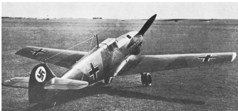
Первый серийный Bf-109 В-1

огромный заказ, когда самолет еще не прошел испытаний в войсках. Но его друг Тео объяснил ему, что времени на раскочку нет – англичане уже запускают в серию свои новейшие истребители «Харрикейн» и «Спитфайр». Надо выпускать то, что есть, и на ходу модифицировать самолет на основе последних данных об опытной эксплуатации. Его завод в Аугсбурге расширяется – строятся новые корпуса, склады и ангары для предполетной подготовки самолетов. Не забывает Вилли и о своих сотрудниках: для рабочих компания строит трехэтажные многоквартирные дома, а для инженеров и технологов – целый поселок семейных коттеджей. Хотя завод и расширяется, его производственных мощностей все равно не хватит, и «сто девятые» обяжут выпускать по лицензии компании «Физлер», «Фокке-Вульф» и «ЭРЛА». Это ли не триумф Мессершмитта в его борьбе с конкурентами?