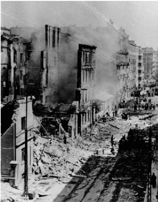
Улица Варшавы после бомбежки

Поведение Англии и Франции непосредственно после падения Польши не поддавалось никакому логическому объяснению. Расправившись с Польшей, Германия не была способна воевать с ними сразу, поскольку понесла ощутимые потери. Рейх располагал запасом бомб всего лишь на 5 дней, 30% самолетного парка было потеряно в боях. Польша своей геройской гибелью дала союзникам реальную возможность