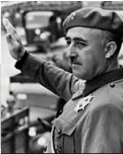
Генерал Франсиско Франко

Вилли считал, что решение Гитлера помочь Франко было правильным. Но вот потом... Что и зачем натворил потом этот человек, который всегда был с ним так приветлив в общении, любил обсуждать с ним перспективы развития авиации и называл его «мой дорогой Мессершмитт»? Откуда в нем была эта неутолимая жажда захвата новых территорий, подчинения и уничтожения целых народов? Зачем было истреблять евреев, которые верой и правдой служили Германии и считали ее своей Родиной? Зачем было захваты-