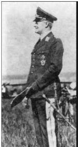
Генерал-лейтенант авиации Вальтер Вефер

но было прославить имя своего главного создателя. Совершенно очевидно было, что новый истребитель будет представлять собой цельнометаллический низкоплан, т.е. крылья будут расположены под фюзеляжем. Самолет будет оснащен мощным V-образным перевернутым мотором жидкостного охлаждения, закрытой кабиной пилота и убирающимся шасси. Кроме того, он должен быть простым в управлении, неприхотливым в обслуживании и ремонте, технологичным в массовом производстве.