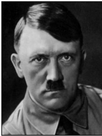
Адольф Гитлер в начале 30-х годов