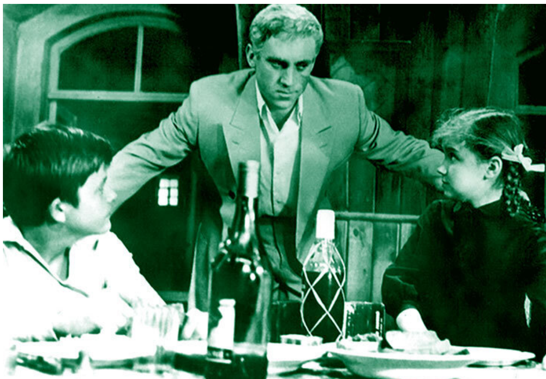
Кадр из фильма «Я родом из детства»