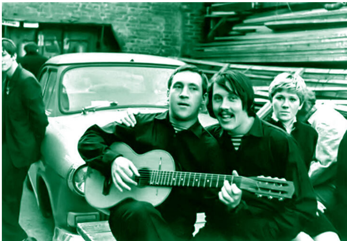
Владимир Высоцкий и Валерий Золотухин.

– Чему ты расстраиваешься? У меня все пять лет так: ни обеда, ни чистого белья, ни стиранных носков. Господи, плюнь на все и скажи мне. Я поведу тебя в русскую кухню: блины, пельмени и пр. – И... повез в ресторан «Центральный»» (там же).