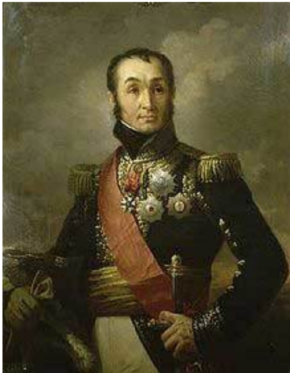
Н.-Ш. Удино (1767–1847) Художник И. Пилс. Середина XIX в.