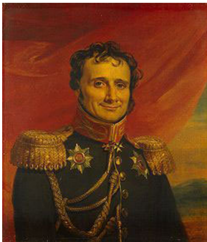
А.-А. Жомини (1779–1869) С 1813 по 1855 год состоял на российской службе. Художник Дж. Доу. 1820-е гг.