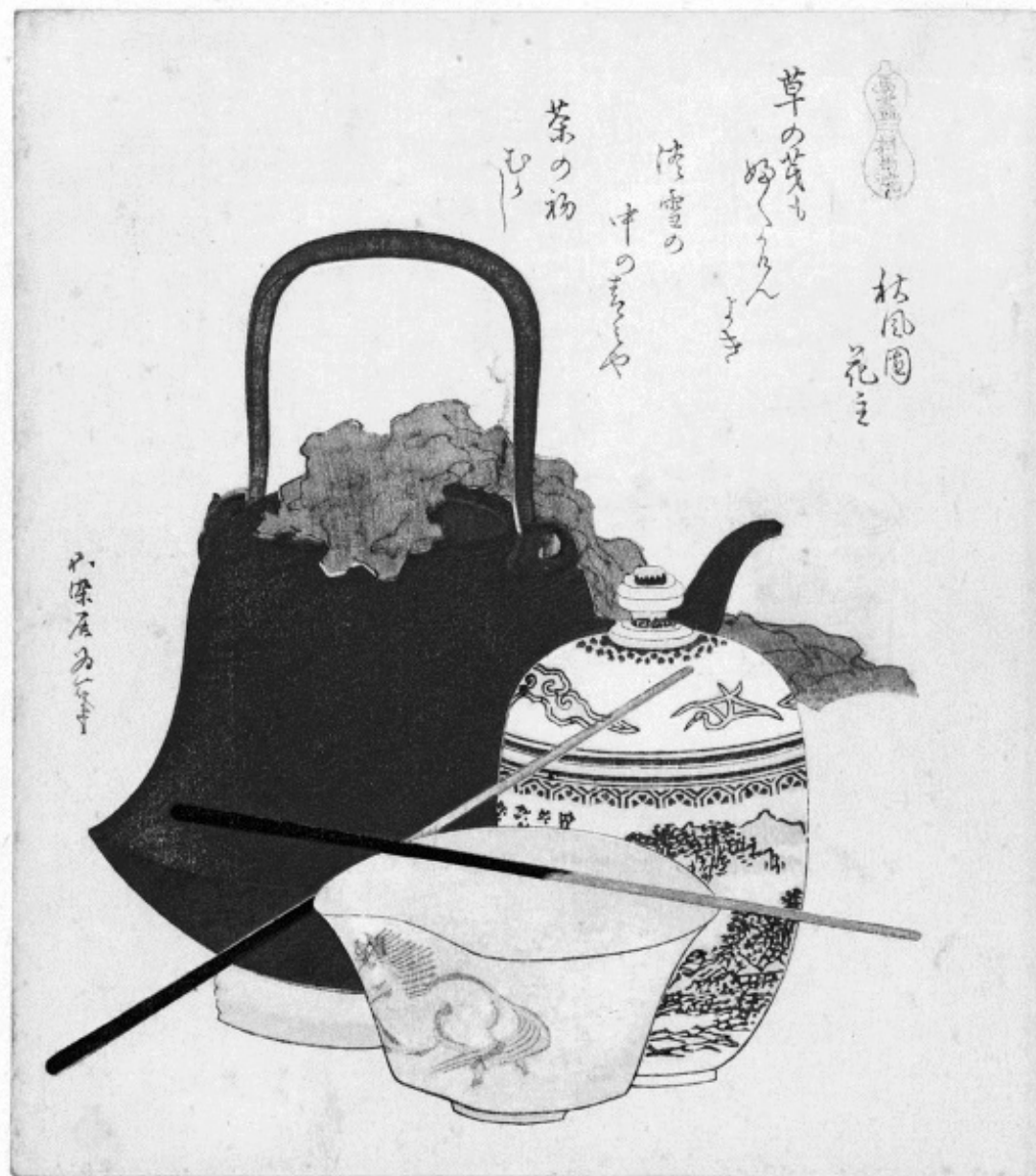
Кацусико Хокусай. Натюрморт.

окружающему город, и, если дома самураев некрасивы снаружи, но совершенны и величавы внутри, люди не будут доверять ни господину, ни самим самураям. С другой стороны, внутренние покои дома, где живут жена и члены семьи, также должны быть правильно обустроены, какими бы невидимыми для чужого глаза они ни были.