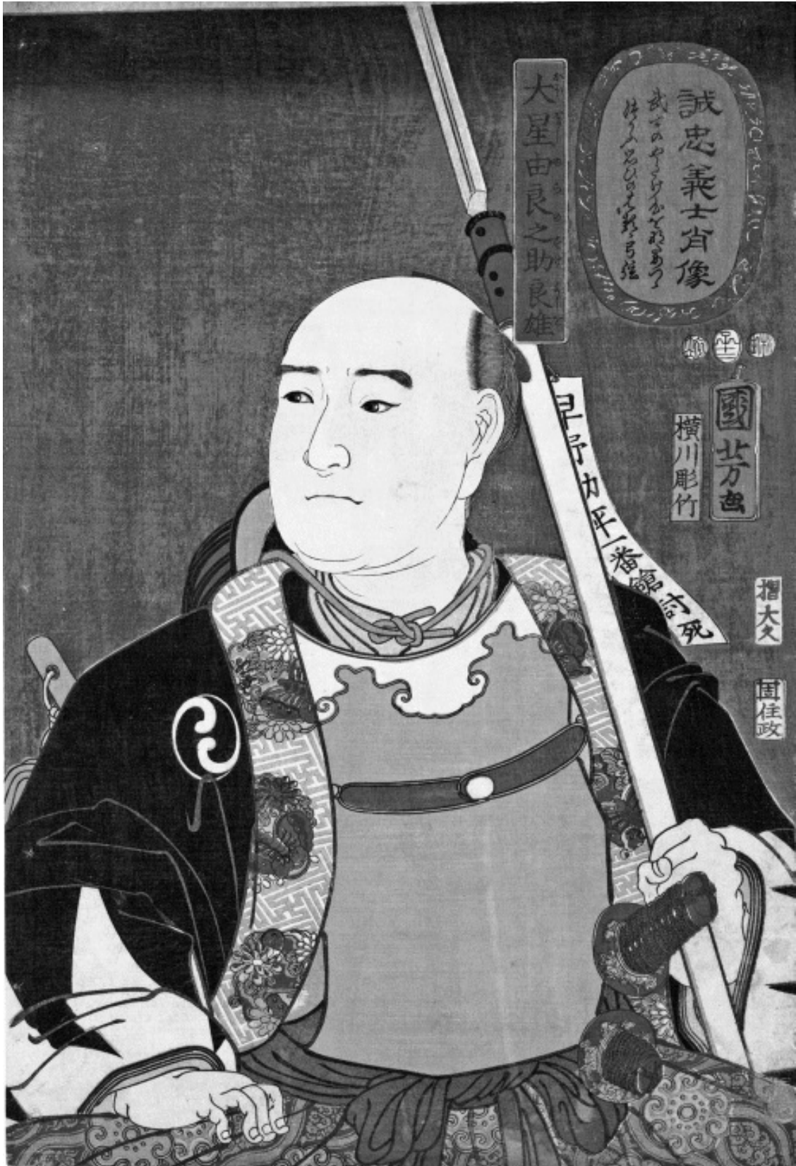
Утагава Куниёси. Портрет добродетельного самурая. 1852.

С другой стороны, тот, кто не отважен, лишь внешне предан господину и почтителен к родителям, не имея никаких искренних побуждений таким оставаться. Безразличный к указа-