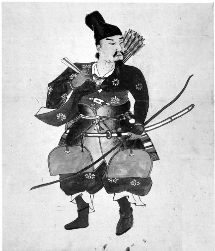
3. Автор неизвестен. Воин-лучник. XIX в.

Такая ошибка проистекает из поверхностного изучения предмета, поэтому начинающие не должны довольствоваться-