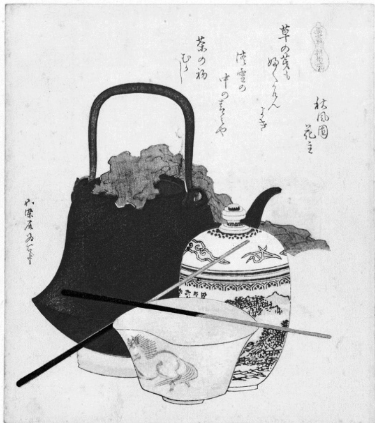
Кацусико Хокусай. Натюрморт.

Они должны надежно укрывать от дождя, и притом следует тратить как можно меньше времени на ремонт и обнов-