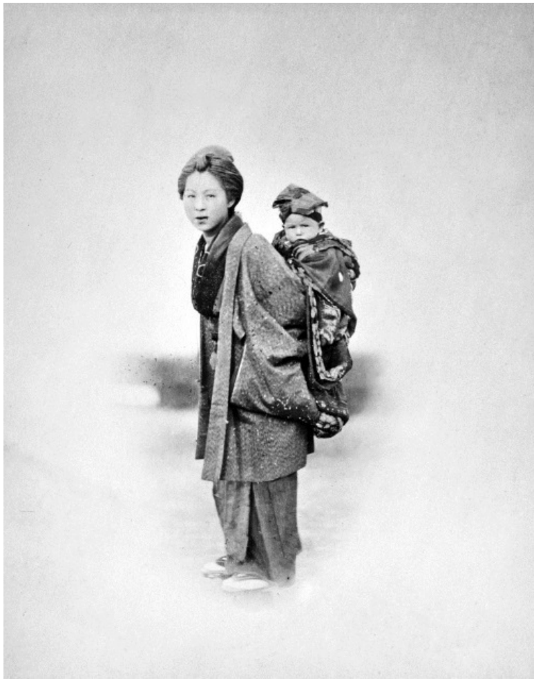
Мать с ребенком на спине. Фото. 1877.