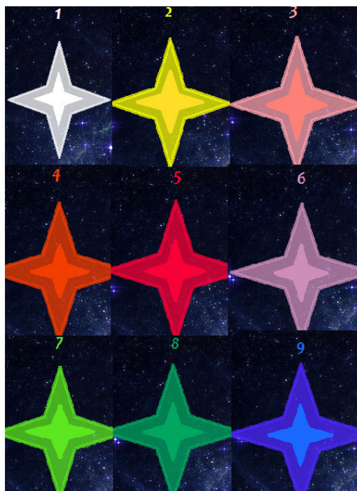
Схема развития души в теории «Астротеизм»

9 «синий» – этап последней и самой совершенной многолучевой звёздочки цвета «Индиго» традиционно женский. Вопреки ложному стереотипу, постепенно достигнуть высшей степени просветления может каждый землянин, а не только инопланетные гости. Индивиды-индиго облагораживали земной мир ещё с древности, с тех самых пор, как появилась разумная и развивающаяся духовная жизнь. Но такая внутренняя энергия души бывает только у девочек, поскольку ангельский и божественный астрал должен иметь материнские свойства. Это энергия жизни, созидания, самопожертвования, любви и мудрости.