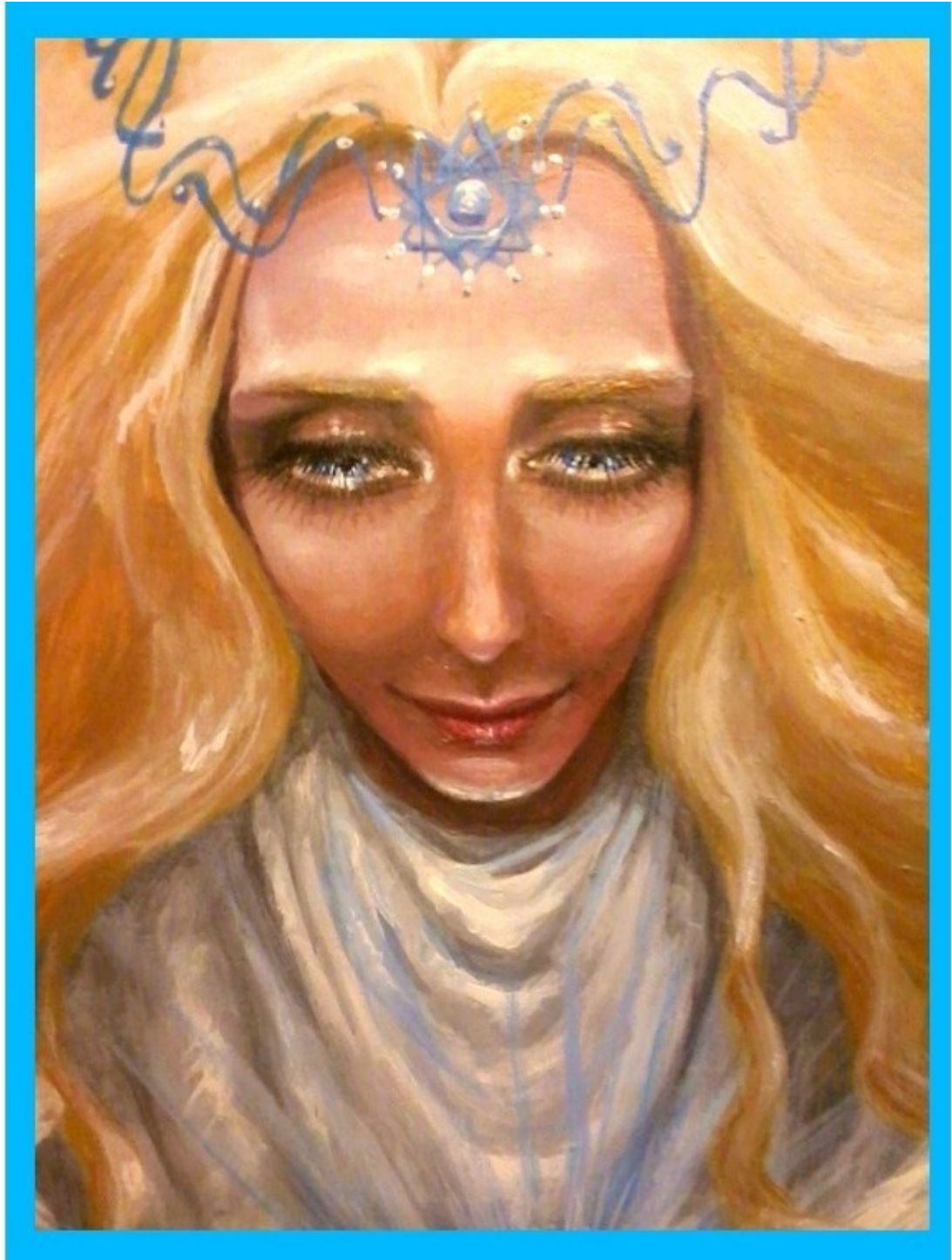
Фрагмент авторской картины «Ангел Сириуса»

Землянам, как заложникам патриархального магнетизма разрушающегося Солнца, будет непросто привыкнуть к тому, что настоящий Творец Вселенной и её звёздного урожая это не седовласый Бог, а цветущие Богини. У истинных божественных сил материнское лицо. А главные миссии – это любовь, забота, мудрость, развитие, созидание и самопожертвование. Аргументов из бородатого эпоса и древних верований можно привести массу, но все они ничто по сравнению с собственным опытом познания, с одним лишь нежным взглядом синеглазой богини сквозь сотни световых лет. Для них люди никогда не будут «рабами Божьими», ведь человечество в незримом рабстве только у демонов и у чужих солнечных богов. Для богинь