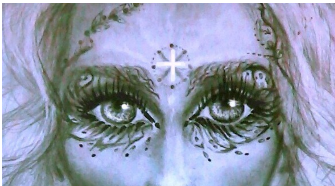
«Звёздная богиня», авторский рисунок Инессы Рэй Индиго

Уверена, многие особенно задумаются об упомянутой дюжине небесных богинь. А как же заоблачный белобородый мудрец или Великий архитектор, отстроивший в одиночку всю прекрасную Вселенную? Астротеизм не исключает участие в жизни нынешних землян богов с мужской энергией и образами. Да только все они на самом деле имеют исключительно солнечную природу, потому что мужественной энергией обладают исключительно ангелы деградирующих звезд или часть уже падших ангелов. Последним человеческим этапом сансары перед тем, как стать звёздным обитателем, астрал проживает именно женскую жизнь (9 этап «Индиго»).