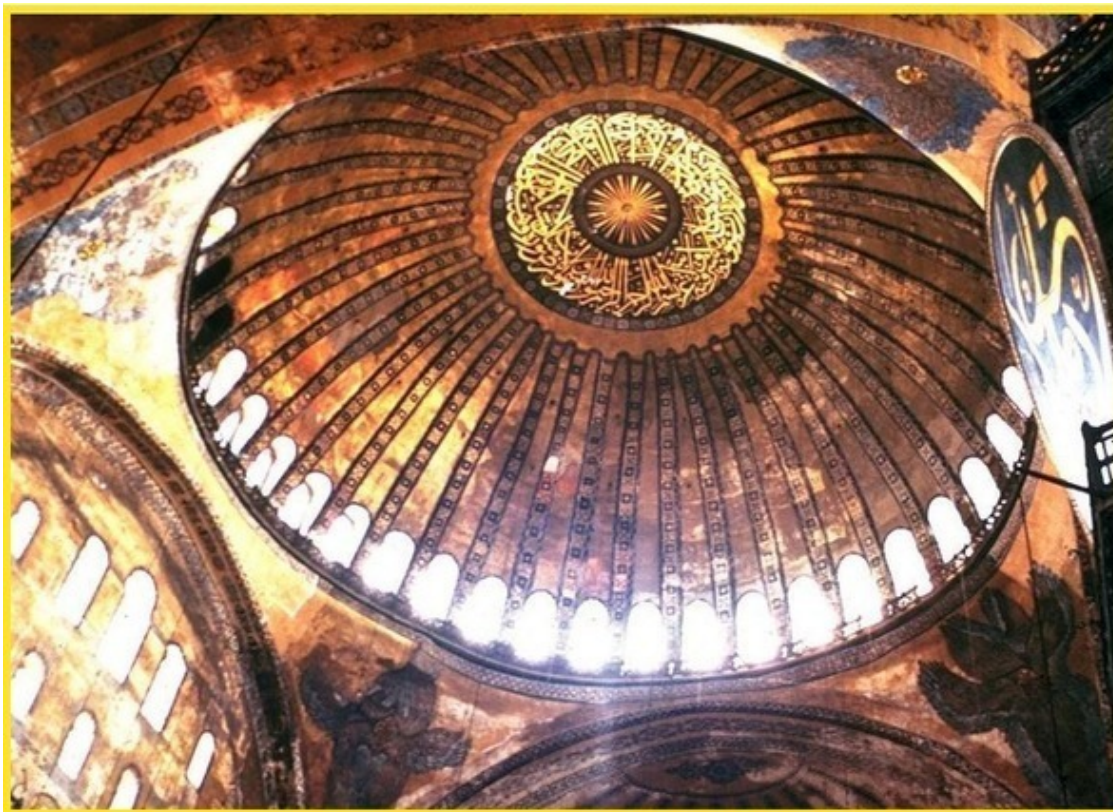
Фото храма в Софии

Теперь рассмотрим поближе божественные силы Солнца. Предлагаю проследовать в соседнюю залу, осенённую золотым светом. Там взору предстаёт аскетичная, но искусно исполненная башенная комната, со стен которой на нас печально смотрят святые с жёлтыми нимбами, в точь повторяющие контуры солнечной сферы. А над головами любопытных экскурсантов лишь старый золотой купол, в раскол которого таинственно подмигивает Луна.