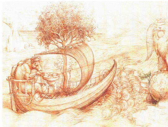
Репродукция рисунка Леонардо Да Винчи.

Остатки различных этносов выживали в подземелье и, дождавшись затишья, выбрались уже к жёлтому солнечному свету. К тому времени уже завершились два губительных этапа сброса плазменных слоёв Солнца вместе с двумя плеядами его звёздных ангелов. Так на изуродованной земле началась эпоха господства падших ангелов Солнца. Поразительно, но древние сакральные знания об отдалении голубой планеты от голубого гиганта созвездия «Большой Пёс», таинственным образом полученные великим художником и мистиком Леонардо да Винчи, иллюстрируются одним его символическим рисунком.