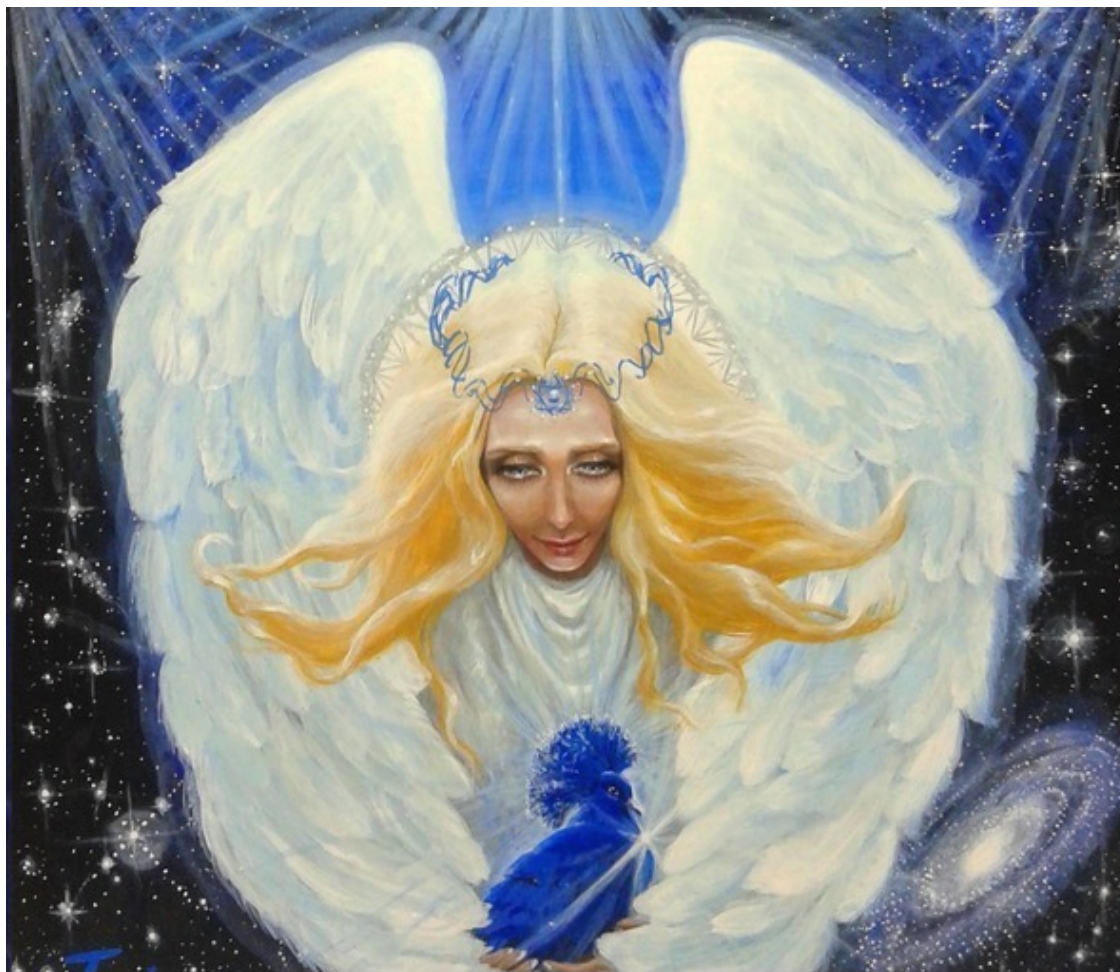
«Ангел Сириуса» авторская работа Инессы Рэй Индиго

Согласно Астротеизму , основанному на возрождённых знаниях, число истинных астральных богов Вселенной неизменно равняется 12. Это максимальный и предельный спектр превращений звёздного вещества. Потому в человеческой культуре эта гармоничная цифра является своеобразным камертоном (12 месяцев, 12 астрологических знаков, 12 апостолов, 12 сивилл и многого другого). За пределами этой системы уже нет других форм духовной жизни, кроме демонической, то есть умирающей, и потому она всегда ассоциируется с числом смерти 13.