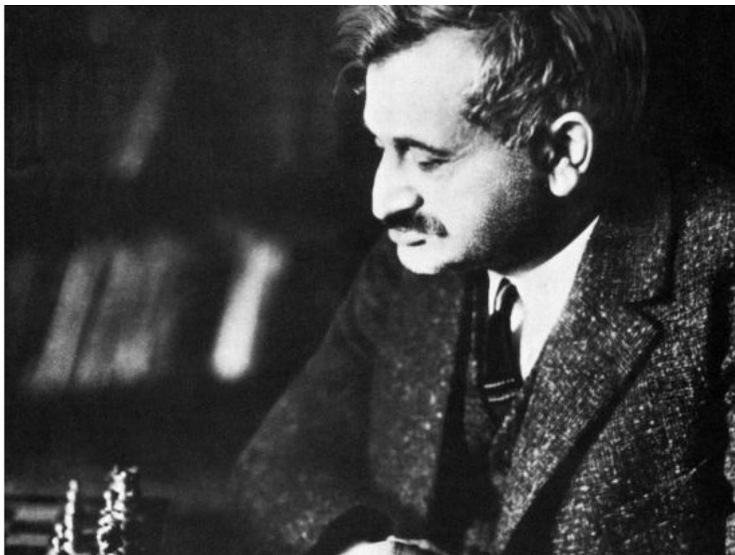
Эммануил Ласкер за шахматной доской

его узнавали на улице, ему приходилось раздавать автографы, как будто он кинозвезда. Такая популярность их с Мартой очень удивляла. Впечатление было, что все граждане СССР – шахматисты.