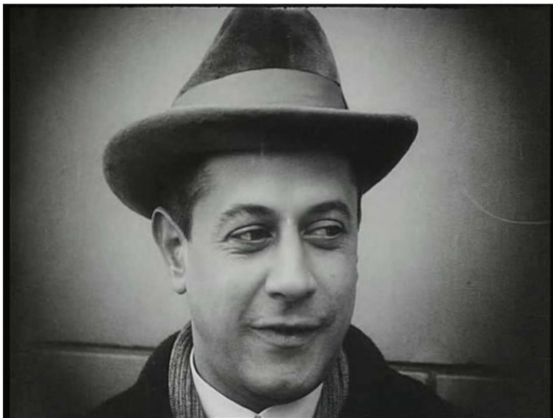
Х. Р. Капабланка в фильме «Шахматная горячка»

Да, это был прекрасный период в жизни Хосе Рауля. Трон его казался незыблемым и прочным. Он разъезжал по всему миру с лекциями и сеансами, его с восторгом принимали почитатели в разных странах, и особенно в СССР, где он даже снялся в роли самого себя в художественном фильме «Шахматная горячка» режиссера Пудовкина.