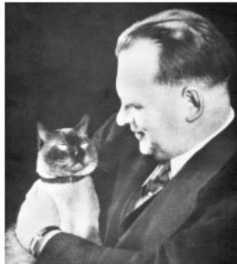
Александр Алехин и его кот по имени «Чесс»

– А Вы знаете, доктор, как поступает волк, забравшись в овчарню? Он пьянеет от крови и режет всех овец подряд до тех пор, пока не придет возмездие с топорами, ружьями и кольями.