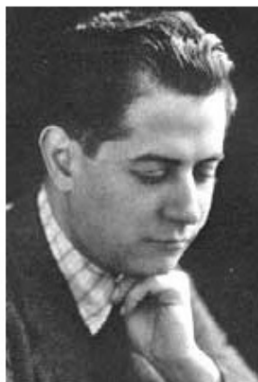
Хосе Рауль Капабланка

Трудно себе представить более далеких от политики людей, чем шахматисты, однако она не оставляет в покое и их тоже. Русская революция вовлекла в свое горнило и опалила Алекина. Сам он, Ласкер, лишился из-за проклятой политики Родины, имущества, дома, денег, вынужден зарабатывать на жизнь тяжелым трудом. Из них троих – самых знаменитых шахматистов современности – повезло в этом смысле только Капабланке. Его политика не касалась, он всегда был баловнем судьбы. Красавец, любимец женщин и всех кубинцев, наделенный огромным талантом. Да что там талант! Капабланка был настоящим шахматным гением. Как бы к нему не относились его соперники, все они признавали гениальность Хосе Рауля Капабланки-и-Граупера, таково его полное имя. Шахматный талант – вещь довольно таинственная. Большинство людей, глядя на шахматную доску с расставленными фигурами, видят лишь кусочки дерева, а для Капабланки шахматы всегда были живыми. Ему обычно не надо было просчитывать позицию, как другим, он ее просто видел во всех нюансах. Свою первую в жизни партию он выиграл у отца, когда ему было всего четыре года, в тринадцать лет он стал чемпионом Кубы, в 1909 году он, победив Фрэнка Маршалла, стал чемпионом Америки.