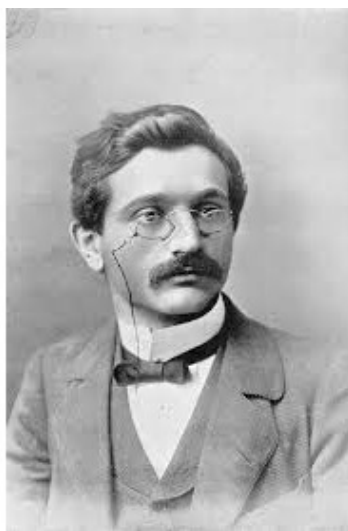
Эммануил Ласкер в молодые годы

Его матч с чемпионом мира Вильгельмом Штейницем состоялся в 1894 году, и путь к шахматному престолу был тернист. Всего за два года до этого Зигберт Тарраш отклонил вызов Ласкера на матч. Мнение этого гроссмейстера значило очень много, и его слово было более, чем весомым. Именно его Штейниц как-то назвал величайшим шахматным гением, которого когда-либо видел свет. Конечно, Штейниц погорячился, ведь Тарраш не сумел завоевать шахматную корону. Но, все же, именно его считают наставником нескольких поколений шахматистов, впервые придавшим шахматной теории форму науки. Именно он покончил с распро-