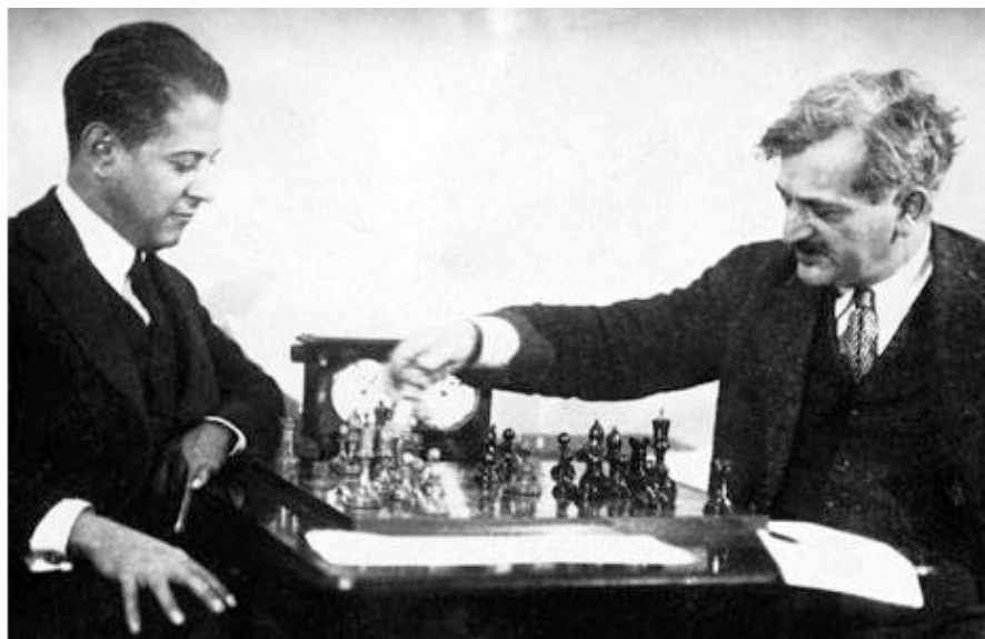
Капабланка и Ласкер за шахматной доской

Таким образом, согласно желанию Ласкера, чемпионом мира перед началом матча объявили Капабланку. И начался матч. Ласкер вовсе не собирался сдаваться без боя. Он атаковал, он рисковал, он усложнял позиции, пытался нащупать бреши в обороне противника, но все его усилия, как волны о скалу, разбивались об изумительную, доведенную до совершенства технику кубинца. Куда же подевалась его буйная, порожденная тропическим климатом фантазия, благодаря которой он в былые времена создавал фантастически красивые комбинации? Она осталась при нем, но для Капабланки отныне главным в шахматах стал спортивный результат. Тот, кто атакует и комбинирует, тот неизбежно рискует, а Хосе Рауль больше не хотел рисковать. Тончайшими маневрами в дебюте и миттельшпиле, не идя на рискованные продолжения, он достигал едва заметного позиционного преимущества, а потом наращивал его шаг за шагом с неумолимостью взведенного часового механизма бомбы и доводил партию до победного результата. Именно тогда Капабланку впервые называли шахматной машиной. Ласкера такая игра претендента буквально ставила в тупик. Он ничего не мог ей противопоставить и терял психологическое равновесие, а тут еще эта изнуряющая гаванская жара. Чемпион мира проиграл пятую, девятую, одиннадцатую и четырнадцатую партию. После четвертого проигрыша он отказался от борьбы и провозгласил кубинца новым чемпионом мира.