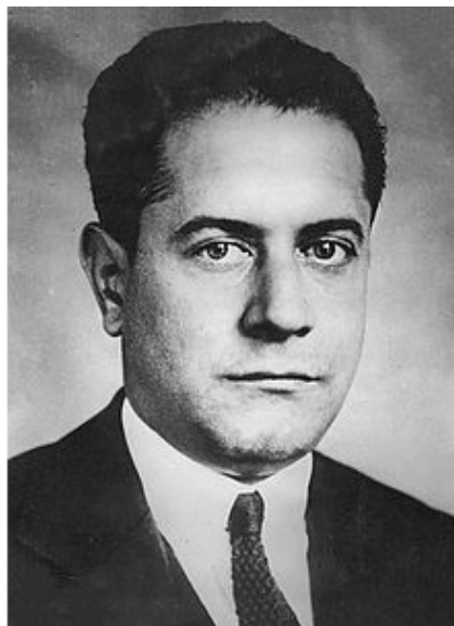
Третий чемпион мира по шахматам Хосе Рауль Капабланка

Торжественная церемония закрытия шахматной олимпиады 1939-го года в Буэнос-Айресе подходила к концу. Снова, как и в далеком 1927-ом году, когда здесь проходил матч за звание чемпиона мира, столица Аргентины стала на время столицей шахмат. Двадцать семь сборных команд из разных стран, восемьдесят самых сильных шахматистов планеты собрались в этом городе, чтобы определить сильнейшую команду. Каждые два года проводится этот великолепный шахматный праздник, на котором играют красивейшие партии, внимание любителей шахмат всего мира приковано к нему. Кроме спортивной борьбы, он интересен еще и тем, что дает возможность встретиться старым друзьям, укрепить старые связи и создать новые.