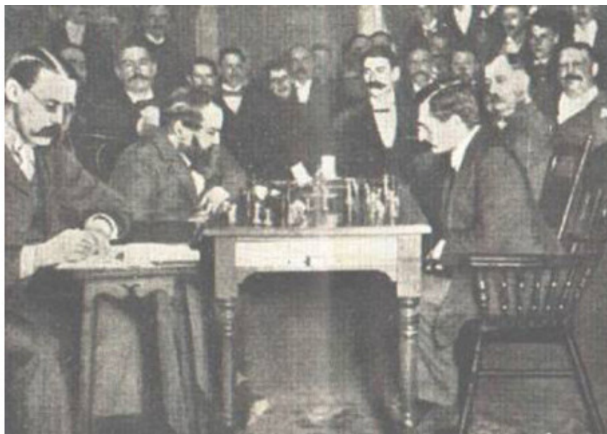
Матч Стейниц-Ласкер за звание чемпиона мира по шахматам

носил дыма. Ласкер и не курил, но от одного вида сигар Нимцович нервничал, не мог сосредоточиться и делал ошибки. Именно Ласкер первым внес в теорию шахматной борьбы элемент психологии. Его психологический метод борьбы был воспринят многими выдающимися шахматистами, прежде всего, Алахиним. А в том матче со Стейницем он впервые доказал всему миру свою правоту. Первые шесть партий противники играли с примерно равной силой, но Эммануил получил перевес в два очка, а вот потом... Потом случился страшный разгром. Стейниц проиграл пять партий подряд. Ласкер его настолько вымотал, что чемпион мира сломался, вошел в состояние «шахматного грогги». Это и предопределило исход матча.