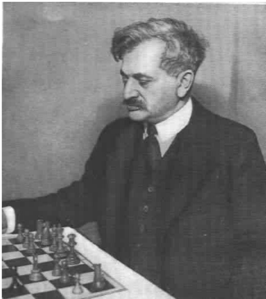
Второй чемпион мира по шахматам Эммануил Ласкер

Напряженный и жаркий день в Бостоне близился к завершению. В большом зале шахматного клуба прямоугольником стояли сорок шахматных столов, за которыми сидели любители разных возрастов и оттенков кожи, а внутри прямоугольника вдоль столов неторопливо расхаживал пожилой седовласый человек небольшого роста с большим крючковатым носом и седыми усами. Он был в черных брюках и светлой рубашке с короткими рукавами. В руках у него была неизменная гаванская сигара, он периодически подносил ее ко рту и выпускал вверх клубы густого ароматного дыма. Любители не жаловались: все знали, что экс-чемпион мира по шахматам Эммануил Ласкер никогда не расстается со своими любимыми сигарами. Это одна из его особенностей и знаменитых причуд. Но разве ароматный дым сигары может воспрепятствовать истинному ценителю шахмат в его намерении увидеть вблизи самого великого Ласкера? И не только увидеть, но и сразиться с ним за шахматной доской? Проиграть ему не зазорно, а если вдруг, чем черт не шутит, удастся свести партию вничью, то потом можно будет как-нибудь в компании небрежно сказать: «Да, было дело летом сорок первого, сыграл я партию в Бостоне вничью с Ласкером. Неплохо еще играл старик, а ведь семьдесят два года уже ему было!»