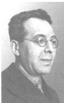
Международный гроссмейстер Григорий Левенфиш

Но вскоре атмосфера в стране стала сгущаться: исчезали известные люди, проходили непонятные судебные процессы, на которых соратники Ленина признавались в каких-то диких преступлениях, расстреляли известных военачальников во главе с маршалом Тухачевским. Когда Эммануил в разговоре с Левенфишем как-то попытался узнать, что он обо всем этом думает, тот слегка побледнел, изменился в лице, покосился в сторону кухни, где хлопотала славная девушка Юлия, и подчеркнуто громко принялся обсуждать одну из партий последнего турнира. А когда они прощались в передней, Левенфиш выразительно посмотрел ему в глаза и поднес указательный палец к своим губам.