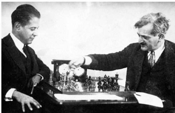
Капабланка и Ласкер за шахматной доской

– Хорошо, – сказал он, – доктор Ласкер, как Вам будет угодно. Я не стану с Вами спорить, но сам себя чемпионом мира буду считать только после победы в матче.