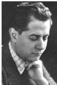
Хосе Рауль Капабланка

баловнем судьбы. Красавец, любимец женщин и всех кубинцев, наделенный огромным талантом. Да что там талант! Капабланка был настоящим шахматным гением. Как бы к нему не относились его соперники, все они признавали гениальность Хосе Рауля Капабланки-и-Граупера, таково его полное имя. Шахматный талант – вещь довольно таинственная. Большинство людей, глядя на шахматную доску с расставленными фигурами, видят лишь кусочки дерева, а для Капабланки шахматы всегда были живыми. Ему обычно не надо было просчитывать позицию, как другим, он ее просто видел во всех нюансах. Свою первую в жизни партию он выиграл у отца, когда ему было всего четыре года, в тринадцать лет он стал чемпионом Кубы, в 1909 году он, победив Фрэнка Маршалла, стал чемпионом Америки.