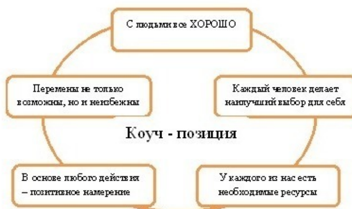
Рис.1.1 – Принципы коучинга

Любая деятельность строится в соответствии с определенными принципами, которые и определяют основополагающие правила, идеи и закономерности построения этой деятельности. Принципы коучинга отражены на рис. 1.1. Они являются основой коуч-позиции – состояния, в котором находится человек тогда, когда создает коучинговое взаимодействие с клиентом [1]. В коуч-позиции может находиться преподаватель, родитель по отношению к ребенку или супругу, руководитель по отношению к сотрудникам, профессиональный коуч на консультации и др.