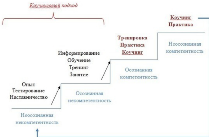
Рис. 1. 5 – Лестница компетентностей

На уровне неосознанной некомпетентности человек осознает свое незнание через новый опыт, сталкиваясь с которым и осознает свою неспособность решить данную проблему из-за нехватки знаний и навыков, а также благодаря тестированию или наставничеству. Таким образом достигается переход на уровень осознанной некомпетентности. При наличии мотивации стать экспертом в данной области, т.е. приобрести компетентность в решении определенного круга задач, возникает интерес как к самообучению, так и к другим формам обучения через тренинги, занятия, семинары, конференции и пр. Переход на уровень неосознанной ком-