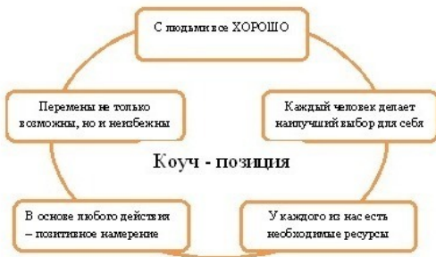
Рис.1.1 – Принципы коучинга

Отличие коучинга от смежных специальностей иллюстрирует график, построенный с помощью 2-х линий, одна из которых – это линии времени, вторая – шкала профессиональной активности специалиста (рис. 1.2). И если деятельность психотерапевтов, психологов, бизнес-аналитиков направлена на решение проблем в прошлом, то деятельность коуча состоит в построении такой формы взаимодействия с клиентом, когда из ситуации «сейчас» мы идем в ситуацию «завтра» через поиск и реализацию целей клиента путем постановки «сильных» вопросов [1].