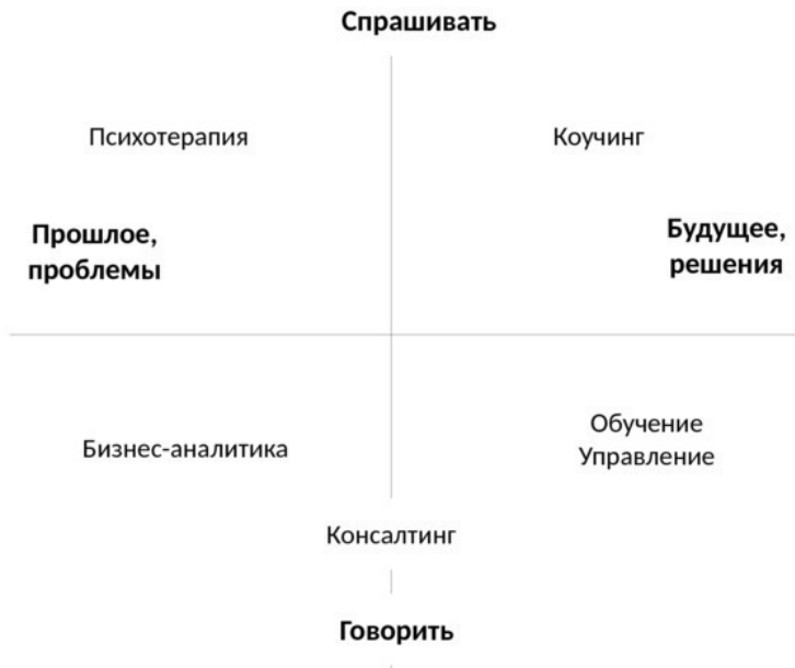
Рис. 1.2 – Отличие коучинга от смежных специальностей

Как же совместить обучение с коучингом? Опора на принципы коучинга в образовательной деятельности с использованием инструментария коучинга составляет основу коучингового подхода к обучению (рис. 1.3).