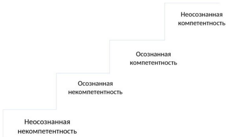
Рис. 1.4 – Лестница компетентностей

вопрос рассмотрим лестницу компетентности.