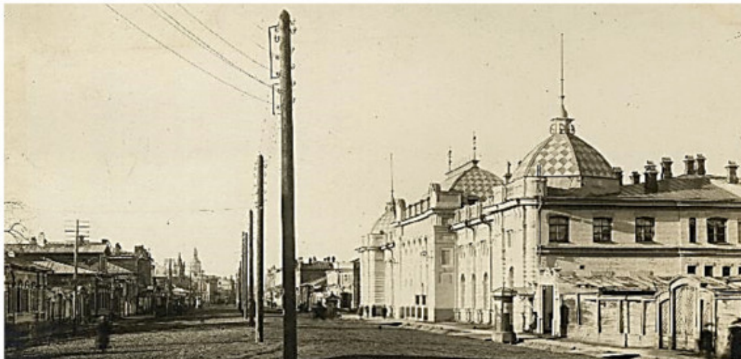
Здание Клуба Октябрьской революции (Клуба совслужащих). Сейчас – ул. Ленина, 23

Пресса и власти, не стеснявшиеся на протяжении двух месяцев в выражениях при изложении состава преступления и не жалевшие красок для описания царившего в ОМХе разврата, превратили заседания в спектакль: «В глубине сцены – стол суда. По бокам – столы защиты и обвинения. Позади стола защиты – тридцать два стула для подсудимых» 29 . Однако, к началу процесса уже несколько перегнули палку: «...часть публики, выражающая настроение обывательской стихии, окружает процесс атмосферой нездорового любопытства и размусоливания так называемых пикантных подробностей, норовя снизить большое и волнующее содержание дела до степени малюсенького анекдота, поданного со скабрешной приправой. Короче говоря, общественная и политическая сущность процесса подменяется похабной сущностью некоторых деталей» 30 .