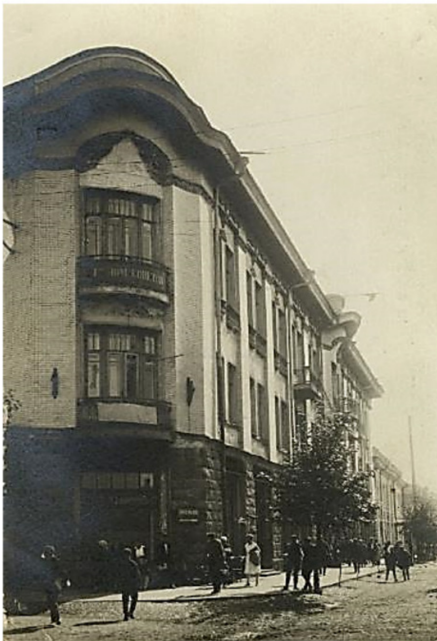
Здание, в котором в 1926 г. располагался иркутской губернский комитет ВКП(б). Сейчас – ул. К. Маркса, 28

Резонанс дела в городе был оглушительный, хотя во многом он, конечно же, был создан самими властями и прессой.