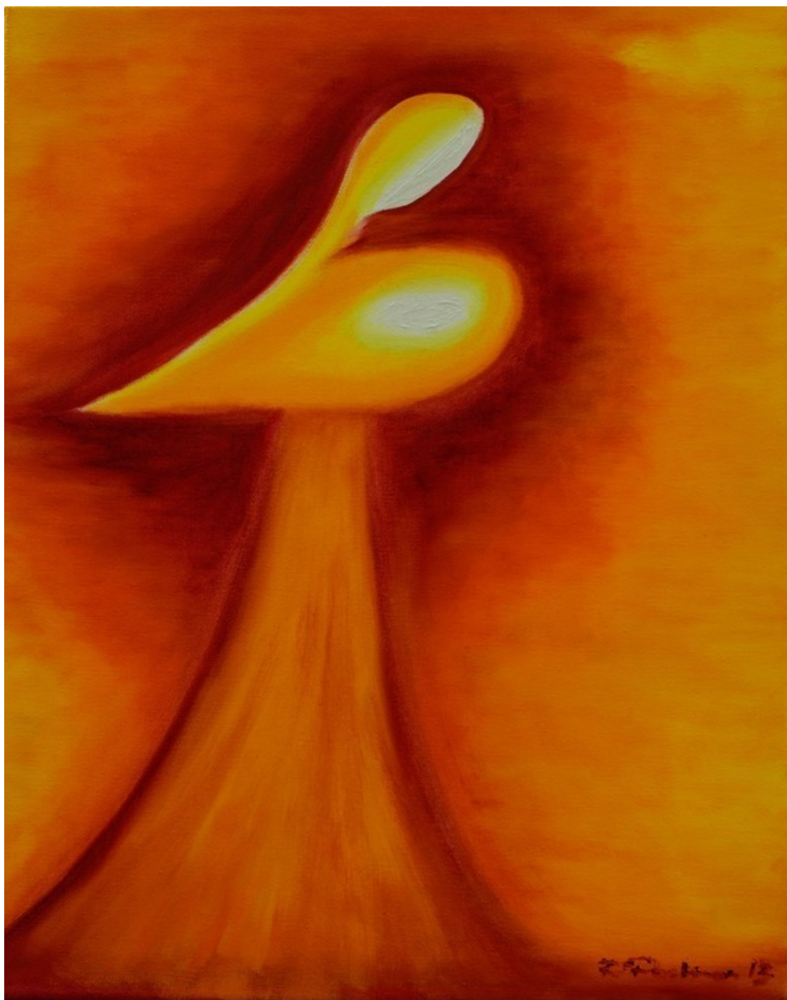
Рихард Пахман, «Материнство»