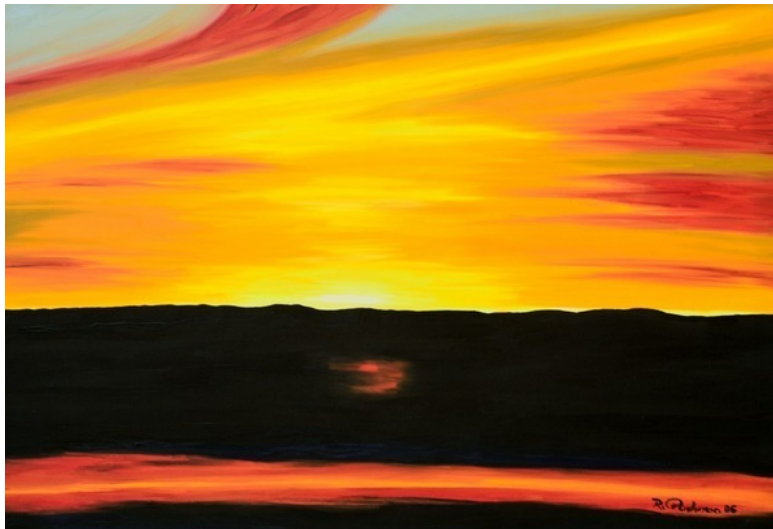
Рихард Пахман, «Закат над Прагой»