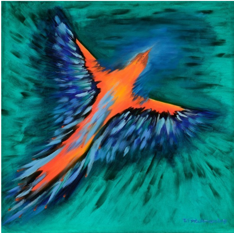
Рихард Пахман, «Летящая птица»