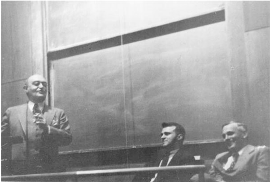
Рис. 1.3. Йозеф Шумпетер, Василий Леонтьев и Пол Суизи в Гарварде, конец 1940-х гг.

Леонтьев: Согласен. Машиностроение, электроэнергетика, и, полагаю, охрана окружающей среды, которая сегодня особенно важна, требуют долгосрочного планирования.