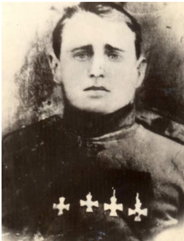
Павел Осипович Показанов (1893–1919), полный георгиевский кавалер Первой мировой (из коллекции Куйбышевского краеведческого музея)

6-й и 9-й полки, сведенные в Отдельную Сибирскую казачью бригаду, выступили на Северо-Западный фронт в июле 1915 г. В 1916 г. 9-й полк сняли с фронта и через Семипалатинск направили в Семиречье для подавления восстания казахов. Затем его перевели в Ташкент, откуда в январе 1917 г. отправили в Персию в состав Русского экспедиционного корпуса. 6-й полк в сентябре 1917 г. вернули в Сибирь (4 сотни в Семипалатинске, по одной в Новониколаевске и Омске). Кроме того, летом 1915 г. в СКВ сформировали и срочно отправили на фронт три отдельных сотни (3 офицера и 157 казаков в каждой). Они несли службу при штабах армейских корпусов, периодически участвуя в боевых действиях. Так, за героизм, проявленный при прикрытии отхода наших войск в течение 18 июня 1917 г. 3-я Отдельная Сибирская казачья сотня получила для награждения отличившихся 25 Георгиевских крестов и 20 Георгиевских медалей. В 1915 г. в Брянске сформировали Сибирский казачий конно-артиллерийский дивизион, в конце этого же года в составе Сибирской казачьей дивизии создается Отряд особого назначения во главе с подъесаулом Б. В. Анненковым 70 .