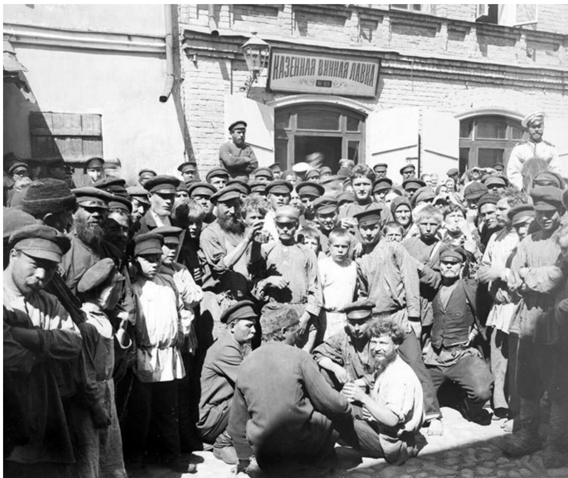
Винная лавка в эпоху казённой монополии