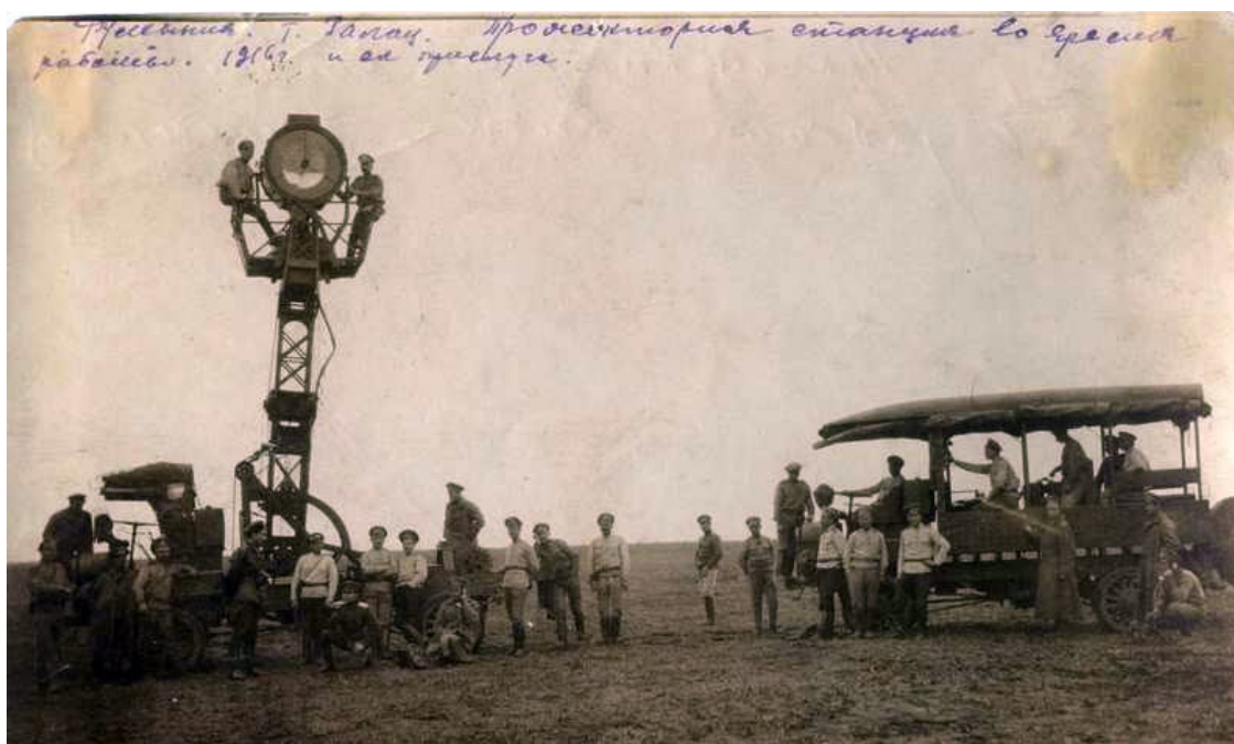
Прожекторная станция во время работы 4-й Сибирский корпус. Румыния, г. Галац, 1916 г.

За этот подвиг, ставший известным всей армии, казаков наградили Георгиевскими крестами. Всего же за осенне-зимние бои 1914 г. только в 1-м Верхнеудинском полку вручили 78 Георгиевских крестов и 28 медалей. В начале 1915 г., как вспоминает тогда сотник 1-го Нерчинского казачьего полка и будущий атаман Г. М. Семенов, на границе с Восточной Пруссией, его подчиненные «вели разведку и состязались с германскими кавалеристами в небольших кавалерийских стычках и ловкости разведчиков. Немцы придерживались системы разведки не менее полуэскадром, а мы предпочитали пользоваться мелкими разъездами, имевшими иногда в своем составе не более 5–6 коней. Наш казак оказался лучшим индивидуальным бойцом, чем немецкий регулярный кавалерист. За полтора месяца практики моей в действии разъездом, при регулярной смене казаков, я захватил в плен свыше 50 германских всадников и не потерял ни одного со своей стороны» 71 .