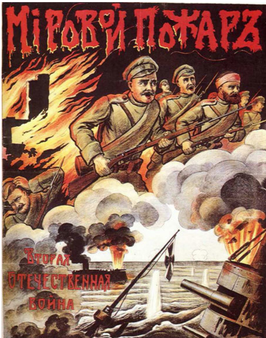
«Мировой пожар. Вторая Отечественная война» (плакат 1914 г.)