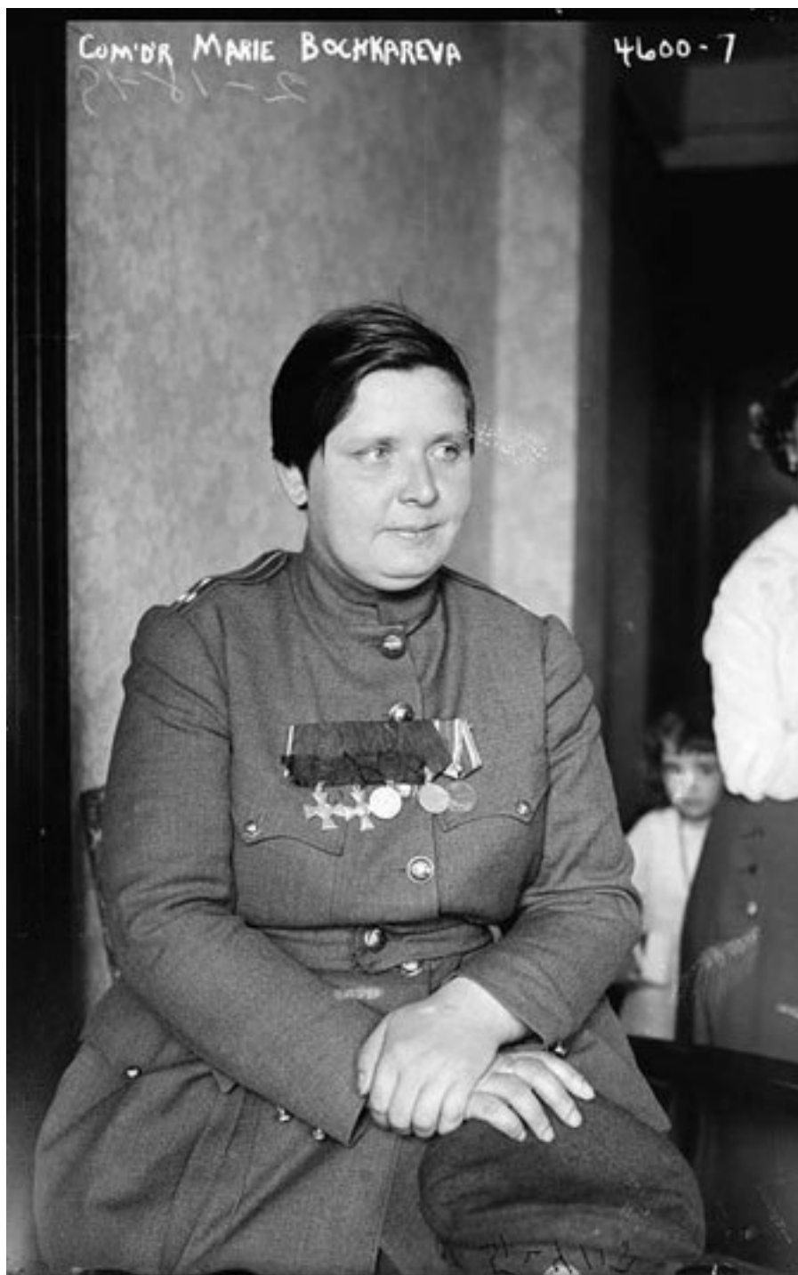
М. Л. Бочкарёва в 1918 г.

В то же время мобилизация запасных породила массовые выступления (бунты) с эпицентром в Томской губернии, где проживало более 40 % населения региона. В сельской местности они происходили с 19 июля до конца месяца. Так, 21 июля в волостном селе Шаховском Барнаульского уезда мобилизованные разгромили волостное правление, дома сельского старосты и волостного писаря, а в с. Павловском «тысячи запасных, следующих в Барнаул» подвергли погрому волостное правление и контору лесничего. В донесении тобольского губернатора А. А. Станкевича в МВД от 21 августа 1914 г. утверждалось, что «мобилизация протекала успешно, при соблюдении в общем полного порядка». Но, «к сожалению, в некоторых местах Тюкалинского уезда и, отчасти Ишимского, порядок этот был нарушен следовавшими