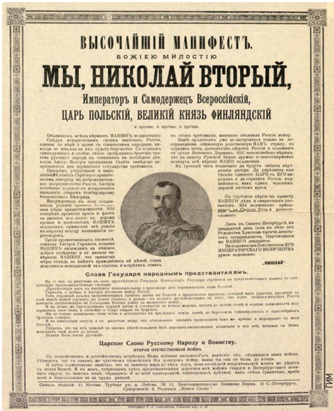
«Высочайший манифест» с объявлением о войне