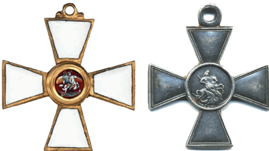
Орден Св. Георгия (слева) и Георгиевский крест (справа)