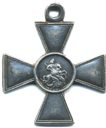
Орден Св. Георгия (слева) и Георгиевский крест (справа)