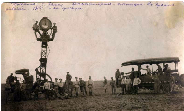
Прожекторная станция во время работы 4-й Сибирский корпус. Румыния, г. Галац, 1916 г.