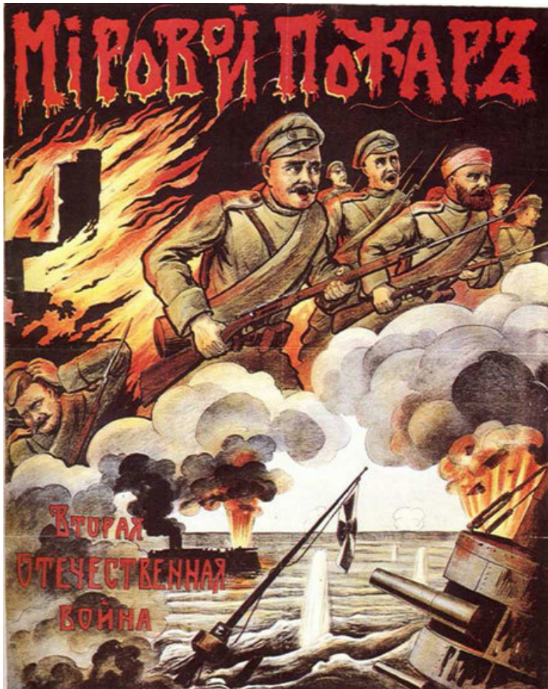
«Мировой пожар. Вторая Отечественная война» (плакат 1914 г.)