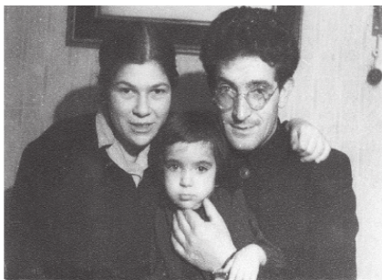
Молодая семья, 1948 г.

внесла весомый вклад в научную и педагогическую деятельность. Ею выполнен ряд значительных исследований в области экологической паразитологии, она – автор более 50-ти научных работ, среди которых имеются как солидные монографии, так и научно-популярные брошюры, помогала она отцу и в науке, работая над библиографией...» В совершенстве владея французским и английским, неплохо зная немецкий, будучи сама паразитологом, она стала отцу поистине незаменимым помощником. Иногда их интересы в науке совпадали, и тогда рождались совместные исследования. Таковой, например, стала монография «Паразиты рыб Белого моря».