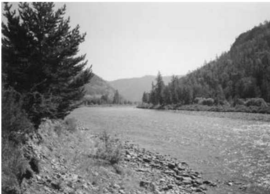
Река Ус – приток Енисея

Путь в будущее Верхнеусинское был долгим и многотрудным. Старообрядцы шли сюда с Беломорья. Вначале они добрались до Урала и несколько лет жили в Пермской губернии, отовсюду гонимые за свою приверженность к старой вере. Далее в их странствиях были реки Тобол, Ишим и другие воды и горы. Но главное направление маршрута не менялось: годами крестьяне-староверы шли на восток, навстречу солнцу. Шли-шли и неизвестно, через сколько лет, наконец добрались до Минусинской котловины – до Енисея и Тубы, обосновавшись сначала в деревне Быстрой. Правда, и здесь они не почувствовали приволья. И здесь, как везде, власти притесняли их, не давали жить и молиться своему Богу, как хотелось.