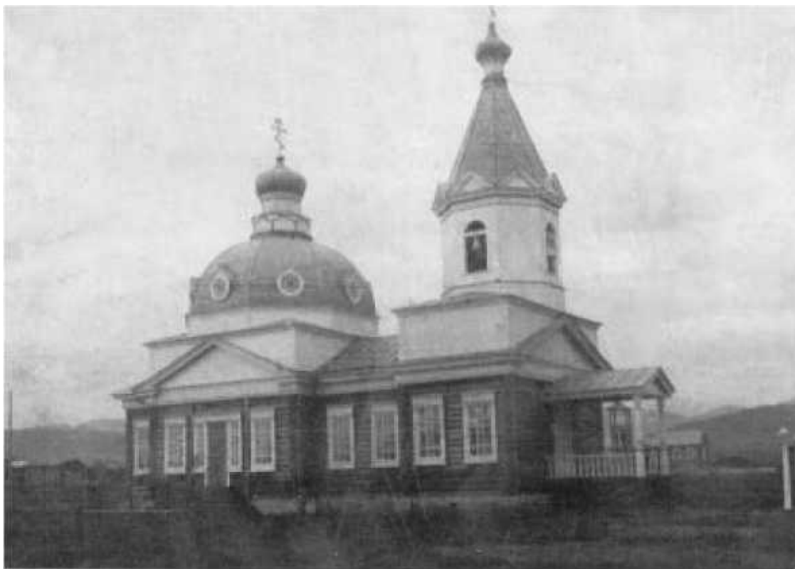
Храм во имя Святителя Николая в Верхнеусинском. Разрушен в 1929 году

Вся надежда была на родственников. Дедушка и его братья жили очень дружно. Сообща построили себе дома. Детей рано приучали к работе – боронить, пасти лошадей, гонять скотину на водопой, чистить глызы, быть погонщиками при пахоте (Гусевым), помогать при скирдовании сена и так далее. На детские игры оставалось совсем мало времени, но кому до этого было дело? Ведь так жили и все остальные дети. Хорошо ещё, что мой отец, как и мать, сумели получить двухлетнее образование, умели считать. И хотя они были малограмотными, большего для деревенской жизни не требовалось. А детские игры всё-таки не прошли мимо них: игра в бабки, лапту, городки, в почекушку. Дети катались на самодельных коньках и лыжах, ходили на ходулях, рано приобщались к рыбалке и охоте. Впрочем, это уже была следующая ступень – шаг к взрослой жизни.