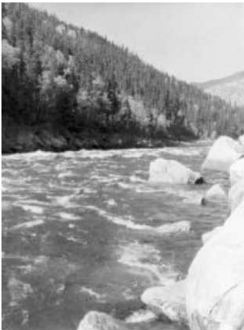
Большой порог на Енисее