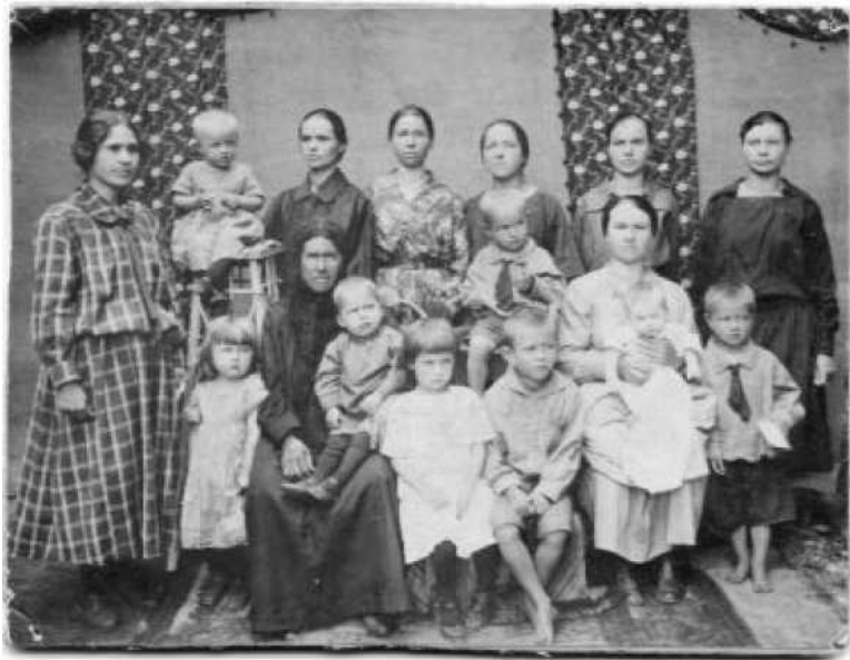
Моя мама со своими детьми в гостях у матери и сестёр Пичугиных. Лето 1926 года

Настоящими крестьянами не становятся. Ими рождаются. Деревенские дети сызмала познают хлебоборбский труд, знают цену куску хлеба. Любовь к природе, к родной земле, к своему месту обитания – малой родине, у них в крови. Настоящий крестьянин знает запах земли. По нему он определяет, когда надо сеять. Землю он чувствует, как самого себя. Так же отец с матерью воспитывали и нас, своих детей, готовя себе смену, растили будущих кормильцев. Но всё случи-