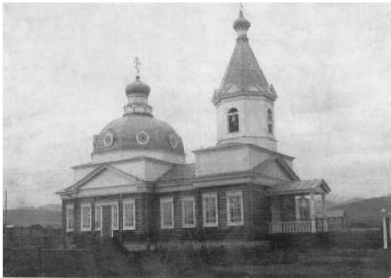
Храм во имя Святителя Николая в Верхнеусинском. Разрушен в 1929 году

Ребятишки в деревне росли закалёнными, физически сильными, хотя и не всегда здоровыми. Ведь никакой медицины не было. Одежда у них была плохонькая, и они часто простужались. Нередко надсаживались при перевозке и переноске грузов, часто недоедали. И с самых ранних лет труд был спутником сельской детворы. Все рано приучались ездить на лошадях, учились их запрягать, седлать, завьючивать. Девочки сызмала водились с младшими братьями и сестричками, учились доить коров, печь хлеб, вязать одеж-