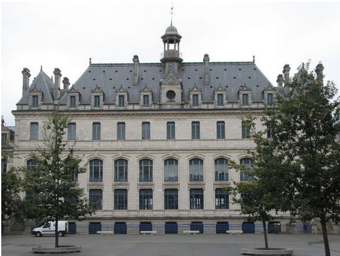
колледж где учился Жорж

Стоит отметить, что в 1791 году было закрыто морское отделение колледжа, готовящее будущих моряков, а в 1794 году, колледж был полностью закрыт и его помещения были переоборудованы под казармы для революционных солдат, что сражались с мятежной Вандеей и Бретанью. И только по приказу Наполеона, в 1803 году, колледж был открыт вновь.