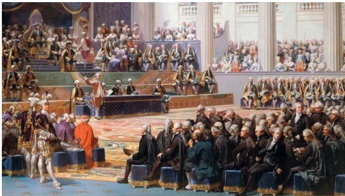
заседание Генеральных Штатов 1789 год

24 января 1789 года вышел королевский указ о созыве Генеральных Штатов и регламенте выборов, первому и второму сословию предоставлялось право избрать по 300 депутатов из своей среды, третьему сословию-600. Дворянство Бретани собирается в Сан-Брие и клятвенно настаивает на своем отказе от любого изменения бретонской конституции, и не посылает своих депутатов в Версаль, развязывая тем самым руки буржуазии. Во время составления списков депутатов в Генеральные Штаты, аристократы исключены из списков, и интересы Бретани едут представлять представители третьего сословия.