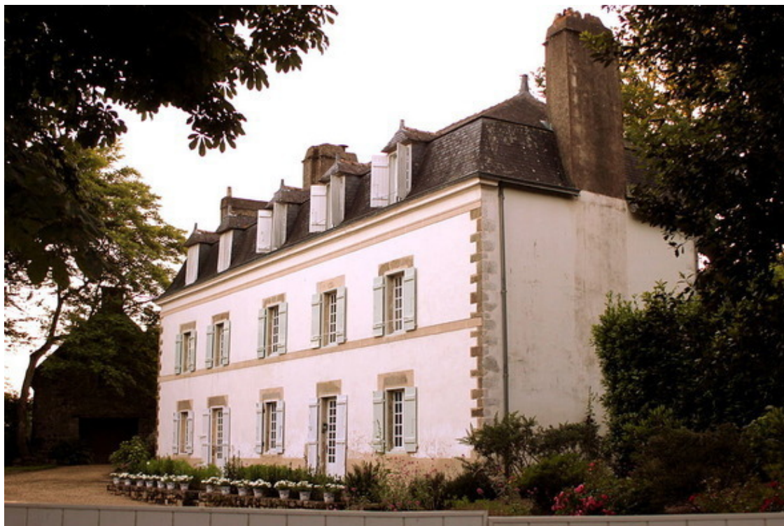
дом где родился Жорж Кадудаль