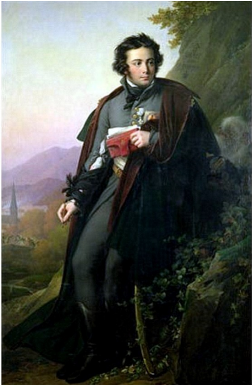
Шарль Мельхиор Боншамп

После переправы через Луару, когда к Королевской и Католической Армии стали присоединятся жители Бретани, добровольцы из Бреши и окрестностей Оре избрали Кадудалья своим командиром. Жорж получает звание капитана, и становится командиром кавалерийского эскадрона, а его люди, каждый по новому ружью.