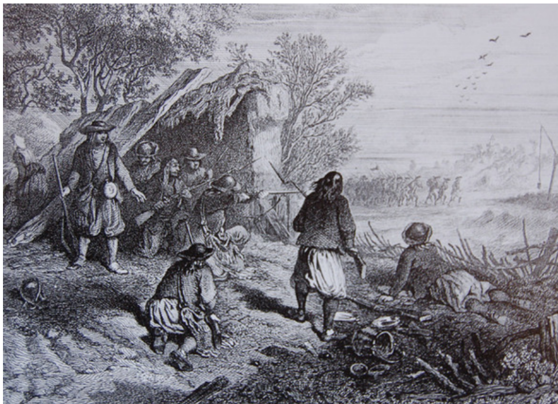
шуаны в засаде

Но настоящий рассвет шуанерии начинается, после выходя в ночь с 23 на 24 февраля декрета конвента о наборе 300 000 рекрутов для защиты «завоеваний революции». До этого, 1 февраля, Франция объявила войну Англии, Голландии, Испании и Сардинии, при этом находясь в состоянии войны с Австрией и Пруссией. Стоит сразу же отметить, что подобный принудительный рекрутский набор был впервые за всю историю Франции! В Королевской Франции служба в армии была добровольной и формировалась она, как сейчас модно говорить «на контрактной основе». После революции, служба в армии была так же добровольной. В августе 1792 года в Бретани набирали волонтеров, то есть добровольцев (!) и этот «добровольный призыв» вызвал такое возмущение у крестьян! А сейчас, уже молодые неженатые люди или вдовцы, от 18 до 45 лет, без детей, в количестве 300 000 должны идти в армию принудительно, без всяких «хочу, не хочу».