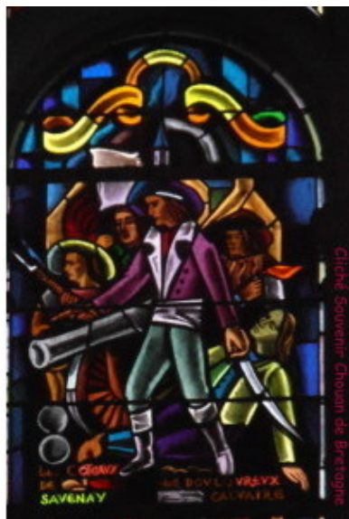
битва при Саване