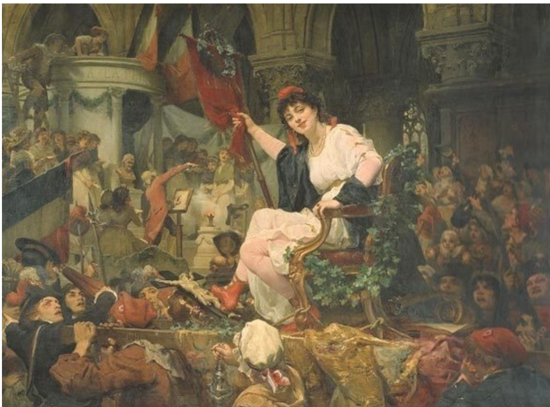
праздник Разума в Соборе Парижской Богоматери

Пьер и Жорж собираются продолжать борьбу, они собираются набирать отряд из местных добровольцев для борьбы с республикой. Недовольство сельского населения высокими налогами, произволом властей, надругательством над верой достигло предела, и в добровольцах недостатка не было. Они путешествуют по деревням, приходам, поднимают народ. Несколько раз они встречаются с семьей Пьера и останавливаются в гостинице Шато-Гонтье. Чувства Жоржа и Лукреции взаимны, они договариваются о свадьбе, их любовь встречает поддержку у родни, но свадьбу решено сыграть только после восстановления монархии, не раньше! Жорж дает обет сражаться до конца, и своё личное счастье видит в осуществлении счастья всей Франции, в лице взошедшего на трон Людовика XVII.